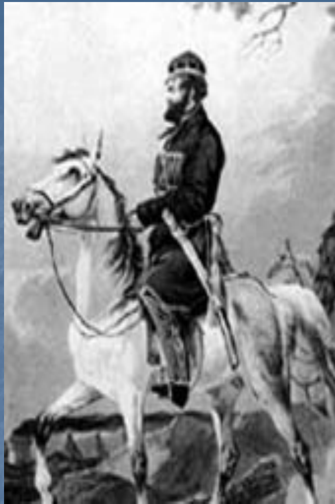
Денис Давыдов – храбрец, гусар, поэт.