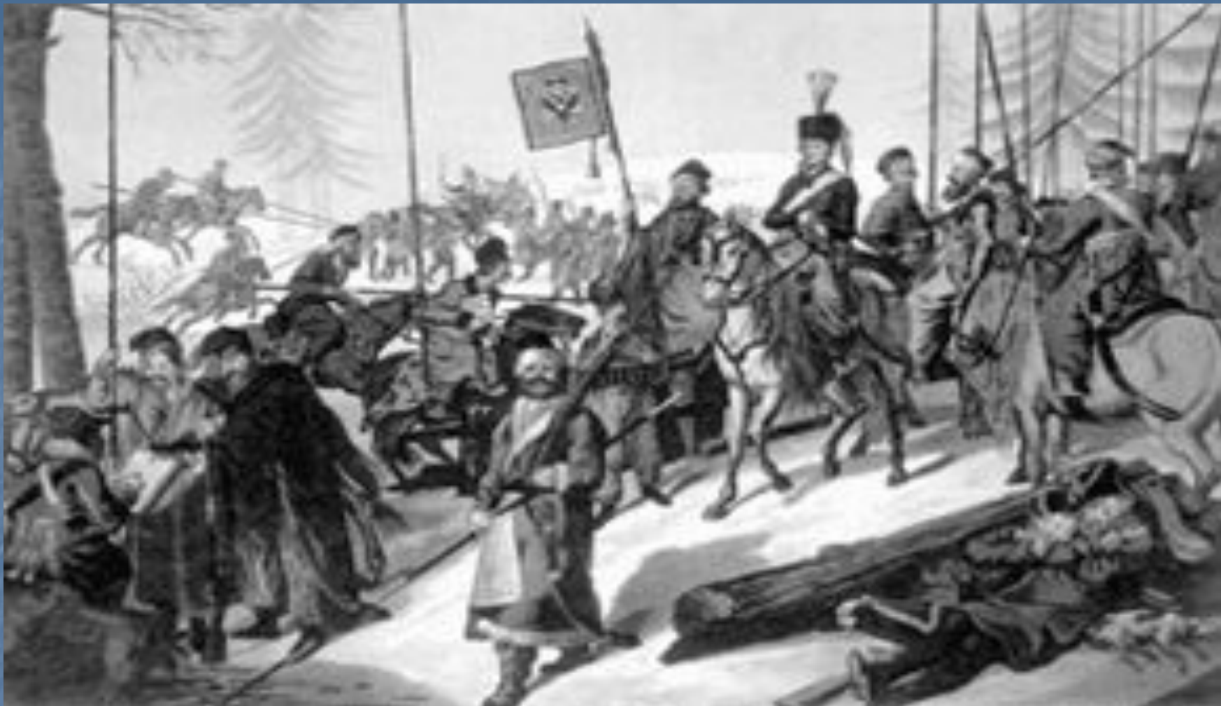
Партизаны в походе