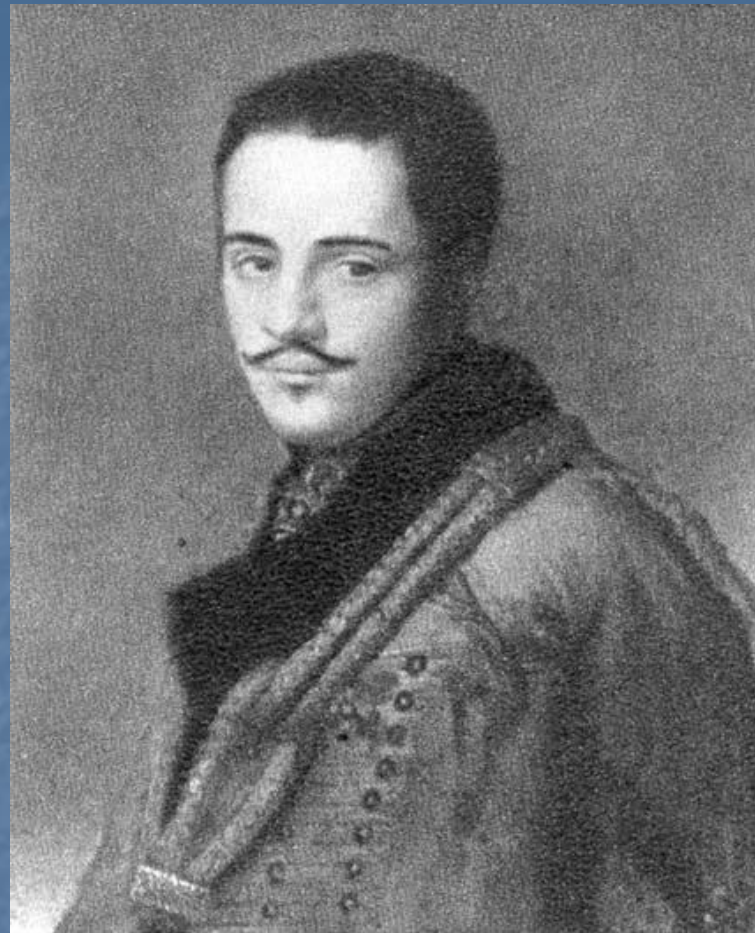
Александр и Николай Раевские