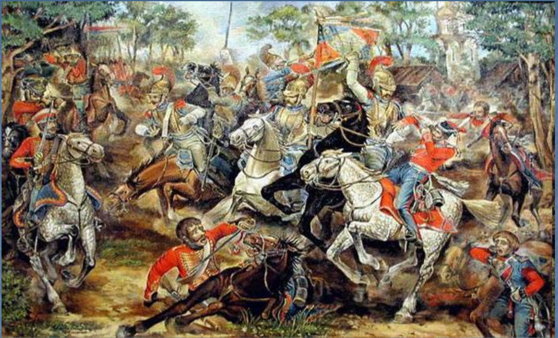
Русская армия. 1812г.