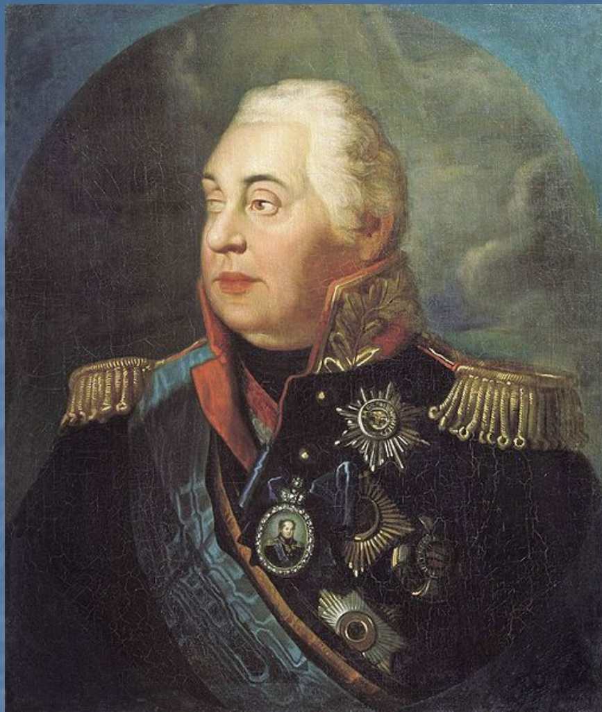
Кутузов Михаил Илларионович