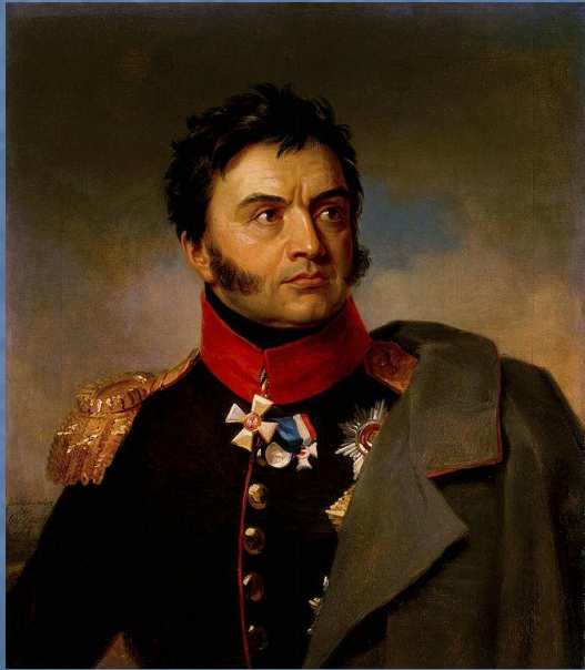
Н.Н. Раевский Чаадаев