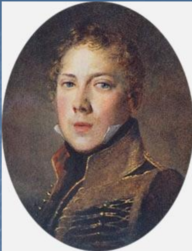
Петр Яковлевич Чаадаев