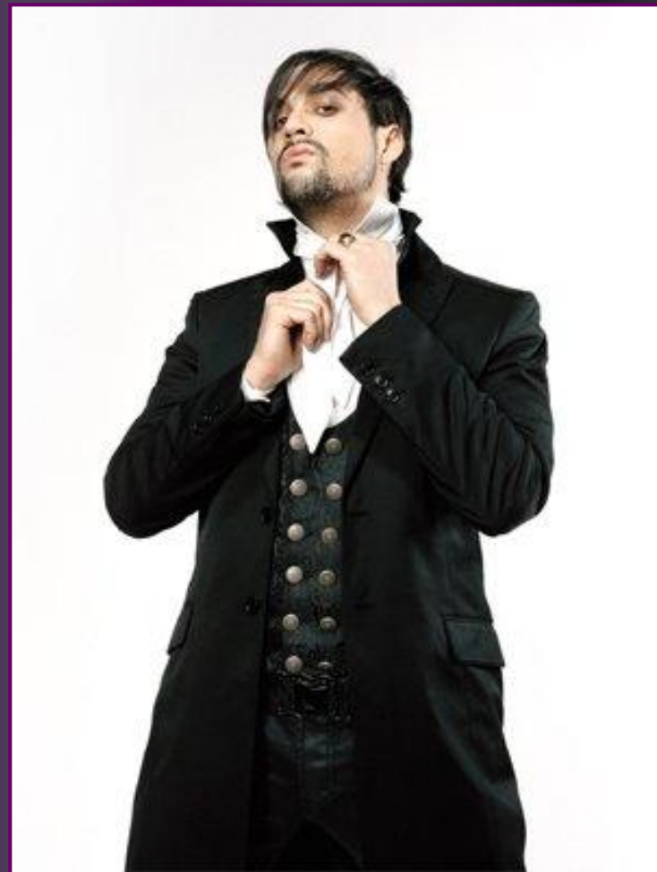
Французский актёр Флорент Мот в образе Сальери