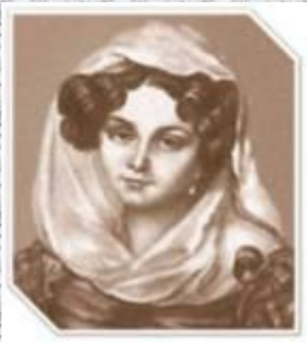
МАРИЯ НИКОЛАЕВНА ВОЛКОНСКАЯ