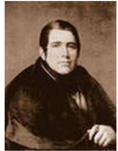
Плетнёв Петр Александрович (1792—1862), русский поэт и критик, академик Петербургской АН

«Ты не можешь вообразить, как весело удрать от невесты, да и засесть стихи писать... Написал я прозою 5 повестей, от которых Березицкий ржет и бьется»