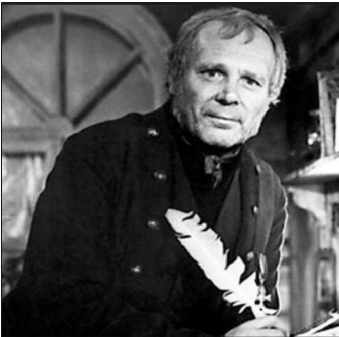
Внешность Самсона Вырина (кадр из фильма)

Самсон Вырин ничем не отличался от представителей своего ранга. Как и другие станционные смотрители, он терпел оскорбления и нахальство со стороны приезжих, чтобы содержать семью. Главной гордостью Вырина была дочь Дуня. Самостоятельная помощница оказалась настоящим подспорьем в жизни мужчины.