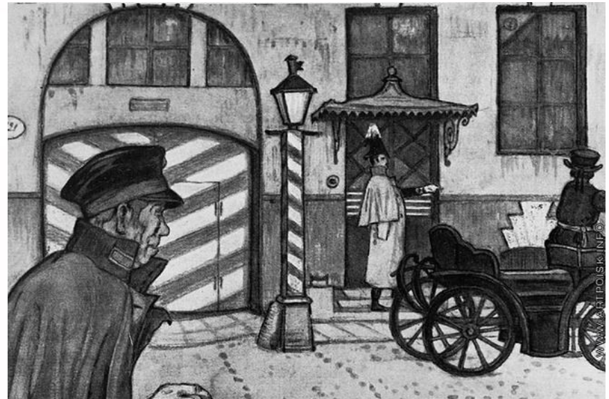
Иллюстрация к повести "Станционный смотритель"