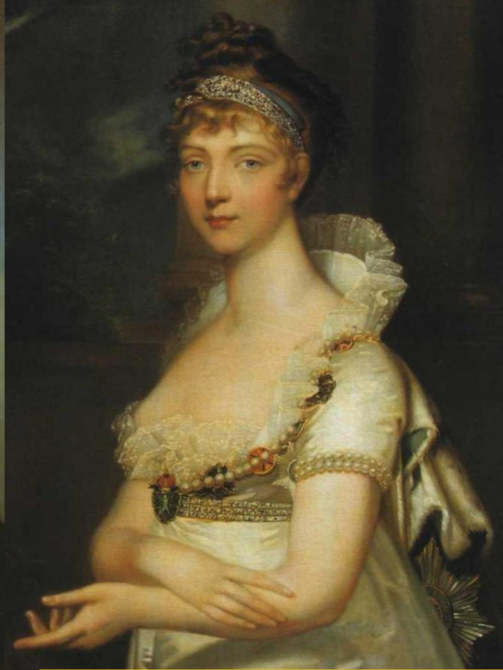
Императрица Елизавета Алексеевна