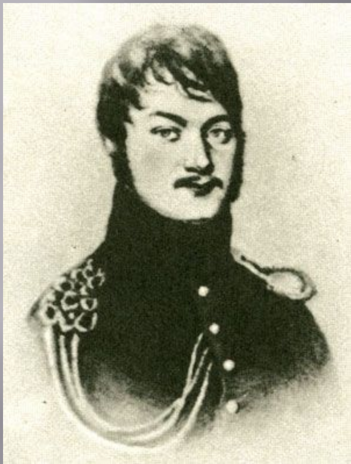
С. Н. Бегичев

“Ты, мой друг, поселил в меня любовь к добру, я с тех пор начал дорожить честностью и всем, что составляет истинную красоту души, ... с тобой я становлюсь нравственно чище и добрее” (Грибоедов).