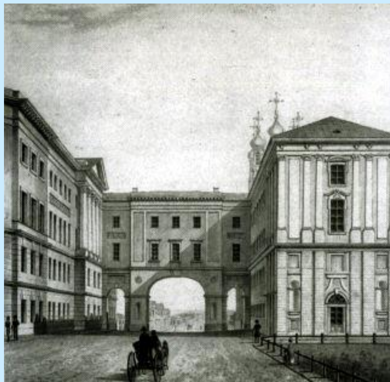
Рисунок XIX века