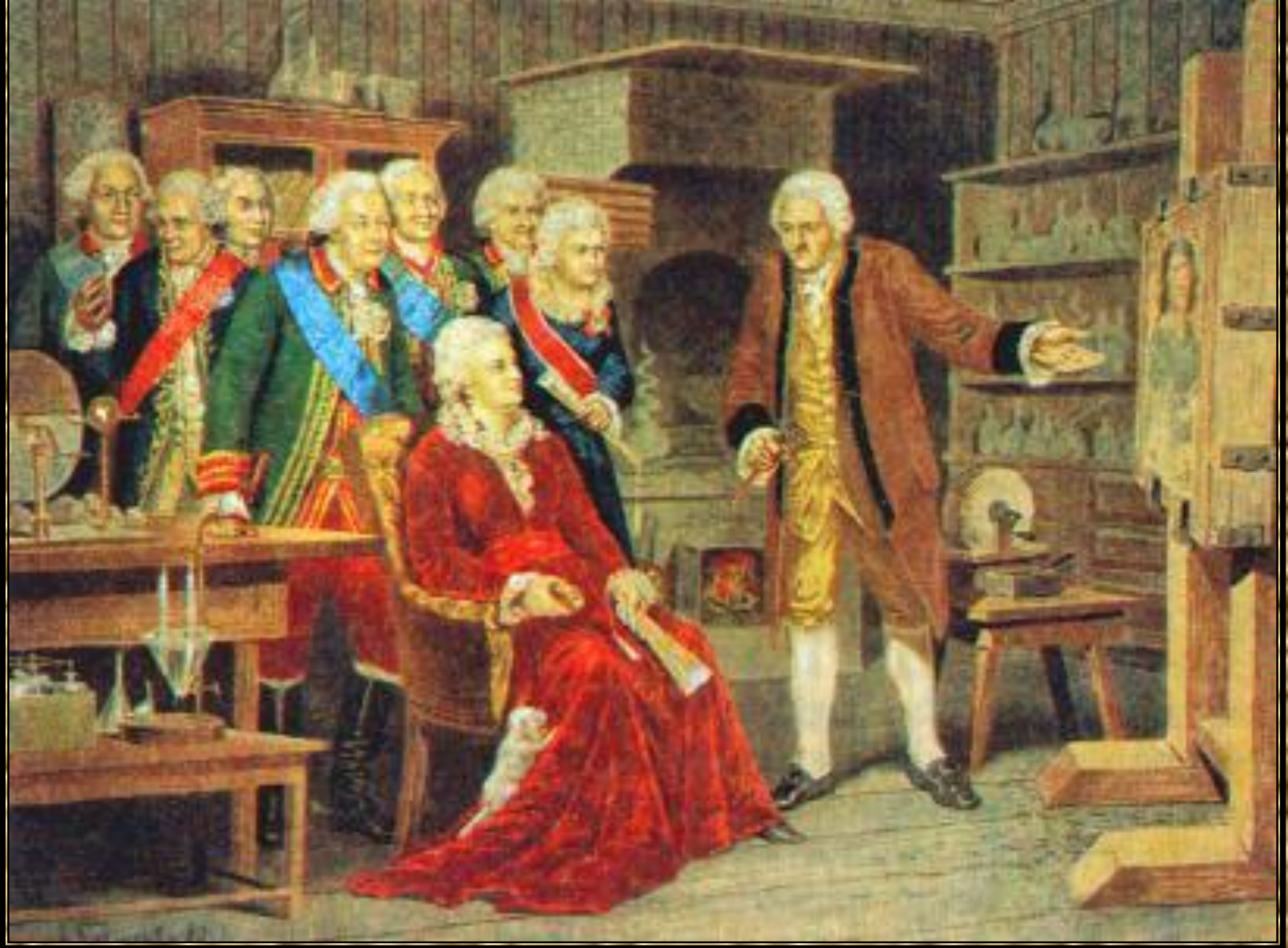
Екатерина II в кабинете М.В.Ломоносова