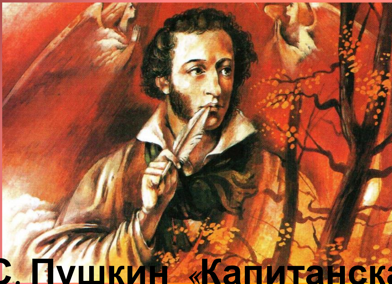
А.С. Пушкин «Капитанская дочка»