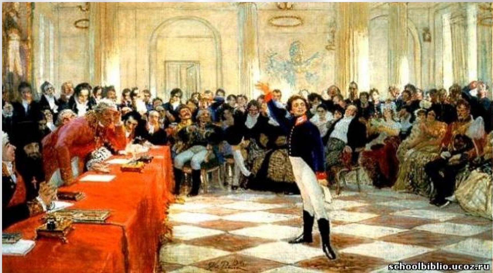
И.Е. Репин "Пушкин на лицейском экзамене в Царском Селе", 1811 г.