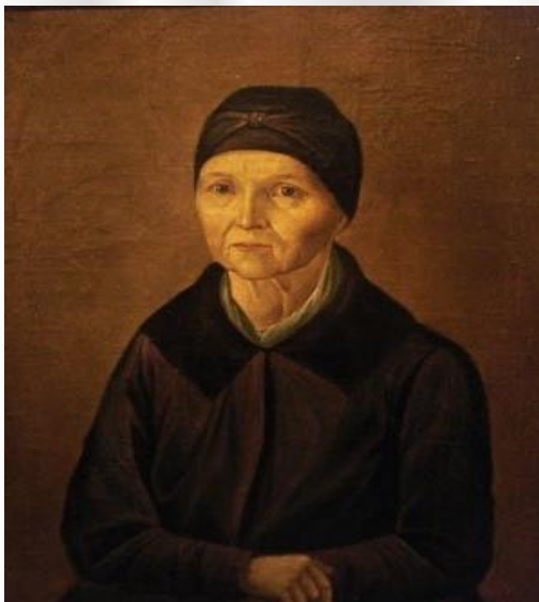
Няня Пушкина, Арина Родионовна