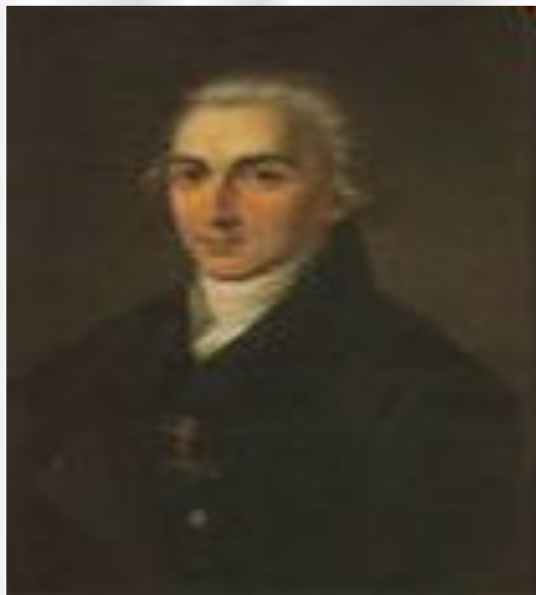
В.Ф.Малиновский, первый директор лицея