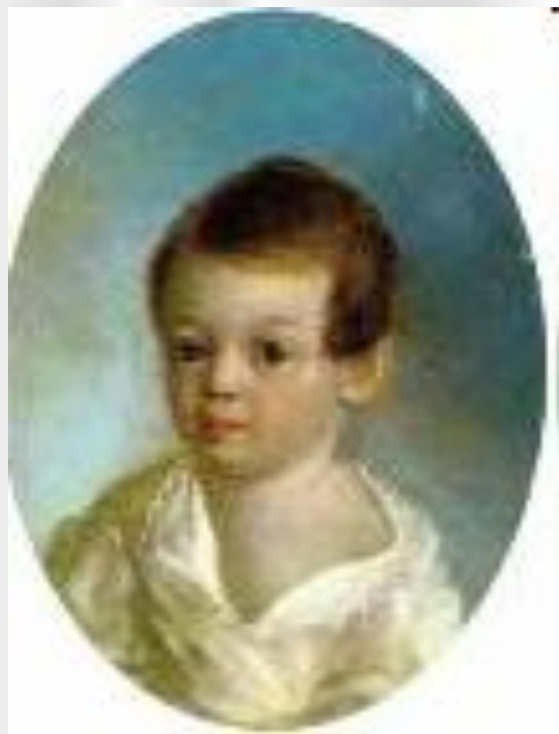
Саша Пушкин Акварель С.Г.Чирикова, 1810