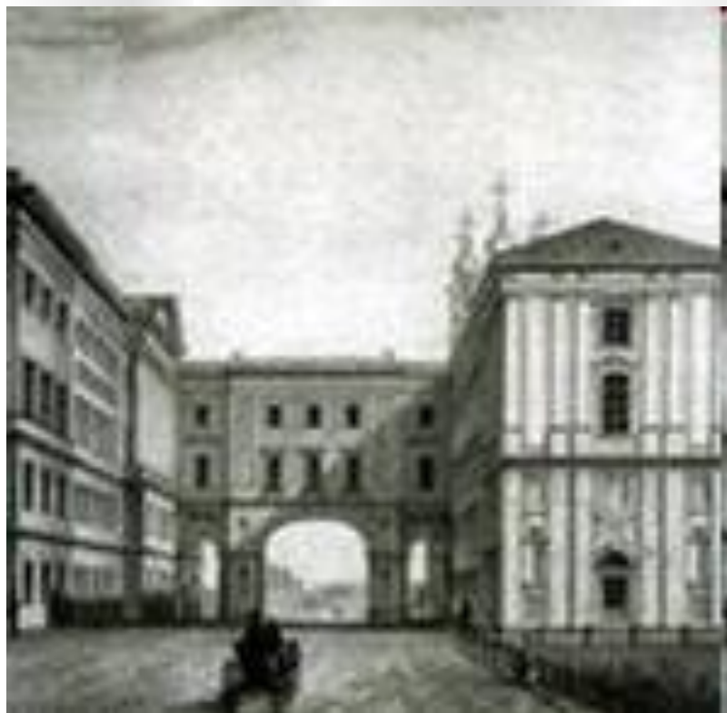
Царскосельский лицей, 1811 год