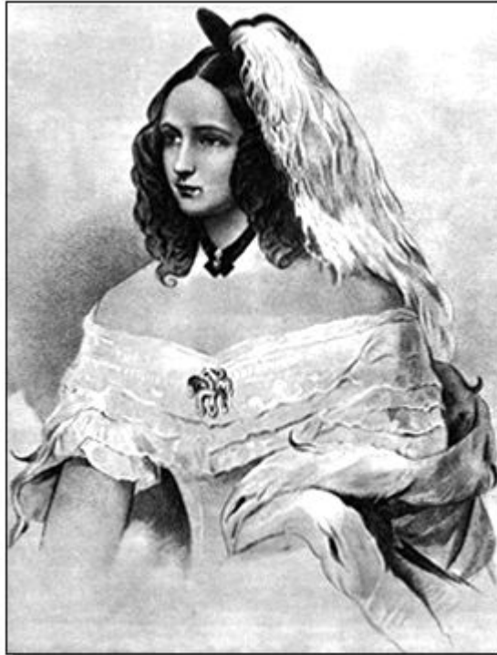
С портрета В. Жау

В конце сентября Пушкин вернулся в Москву и снова стал бывать у Гончаровых: его чувство к Наталье Николаевне не угасло. Наконец, предложение Пушкина было принято, и 6 мая 1830 года состоялась помолвка.