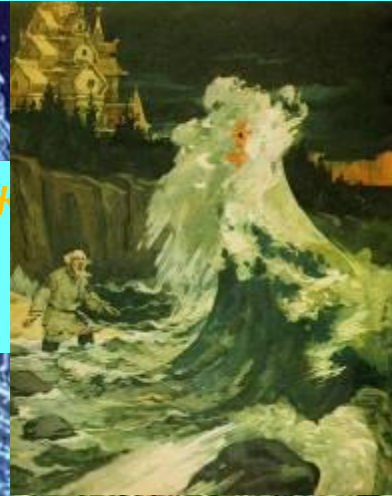
Сказка о мёртвой царевне

Какие произведения А.С. Пушкина вы знаете?