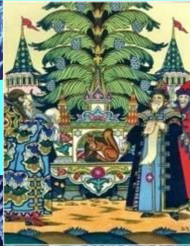
Сказка о золотом петушке