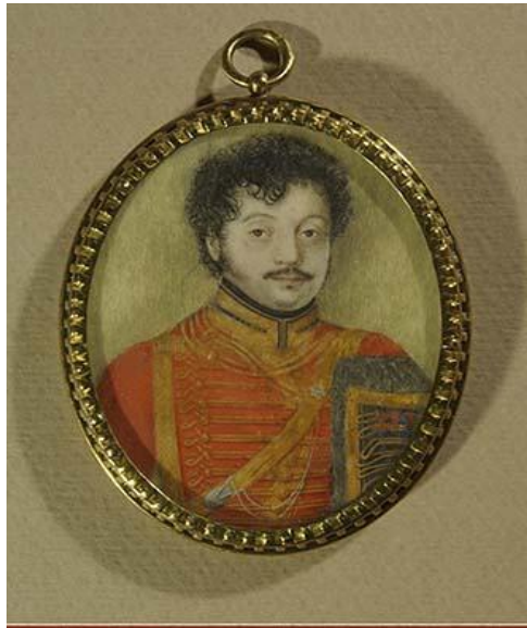
Павел Исаакович Ганнибал (ок.1776 – до 1841).

Портрет написан неизвестным художником в 1810-е годы. Миниатюра, кость, акварель, гуашь.