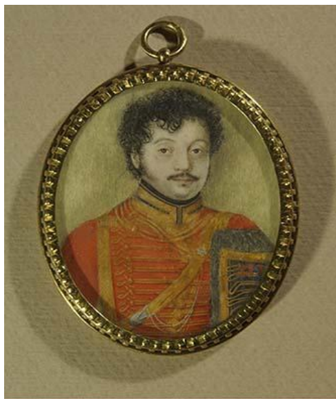
Павел Исаакович Ганнибал (ок.1776 – до 1841).

Портрет написан неизвестным художником в 1810-е годы. Миниатюра, кость, акварель, гуашь.