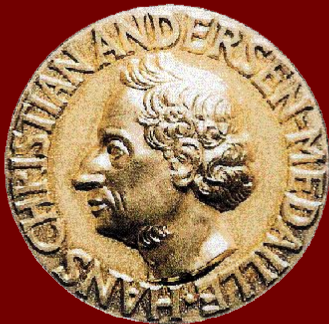
Hans Christian Andersen Medal

Творчество Астрид Линдгрен было отмечено многими престижными литературными наградами. В 1958 году она была удостоена медали Ганса Христиана Андерсена