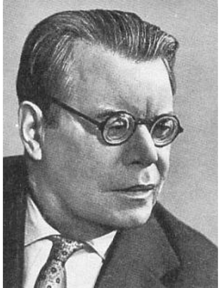
Михаил Васильевич Исаковский

Однажды, собрав несколько стихотворений, Твардовский принёс их Михаилу Исаковскому, работавшему в редакции газеты «Рабочий путь». Исаковский встретил поэта приветливо, став другом и наставником молодого