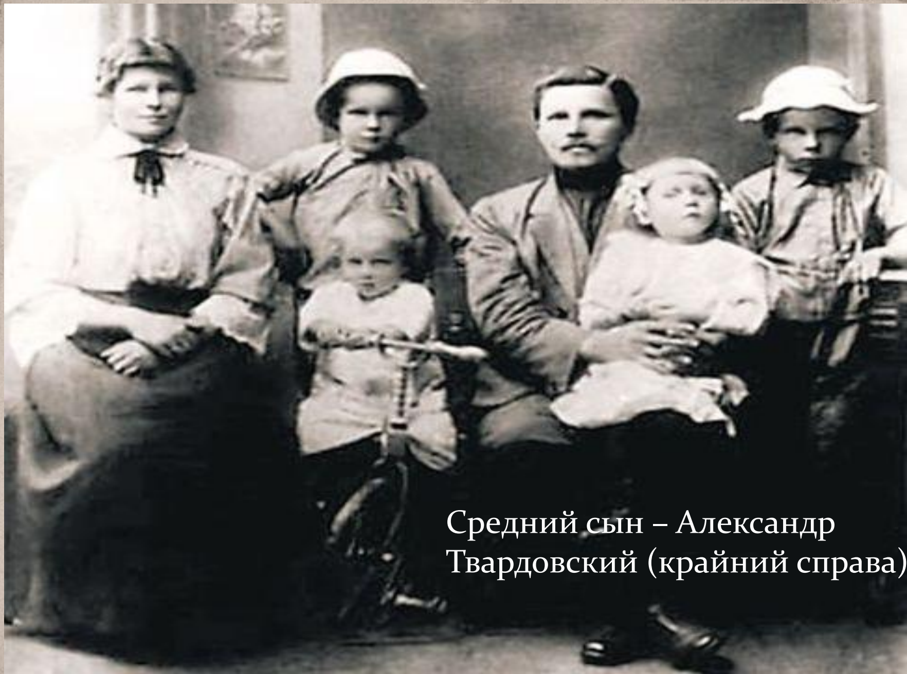
Средний сын – Александр Твардовский (крайний справа)