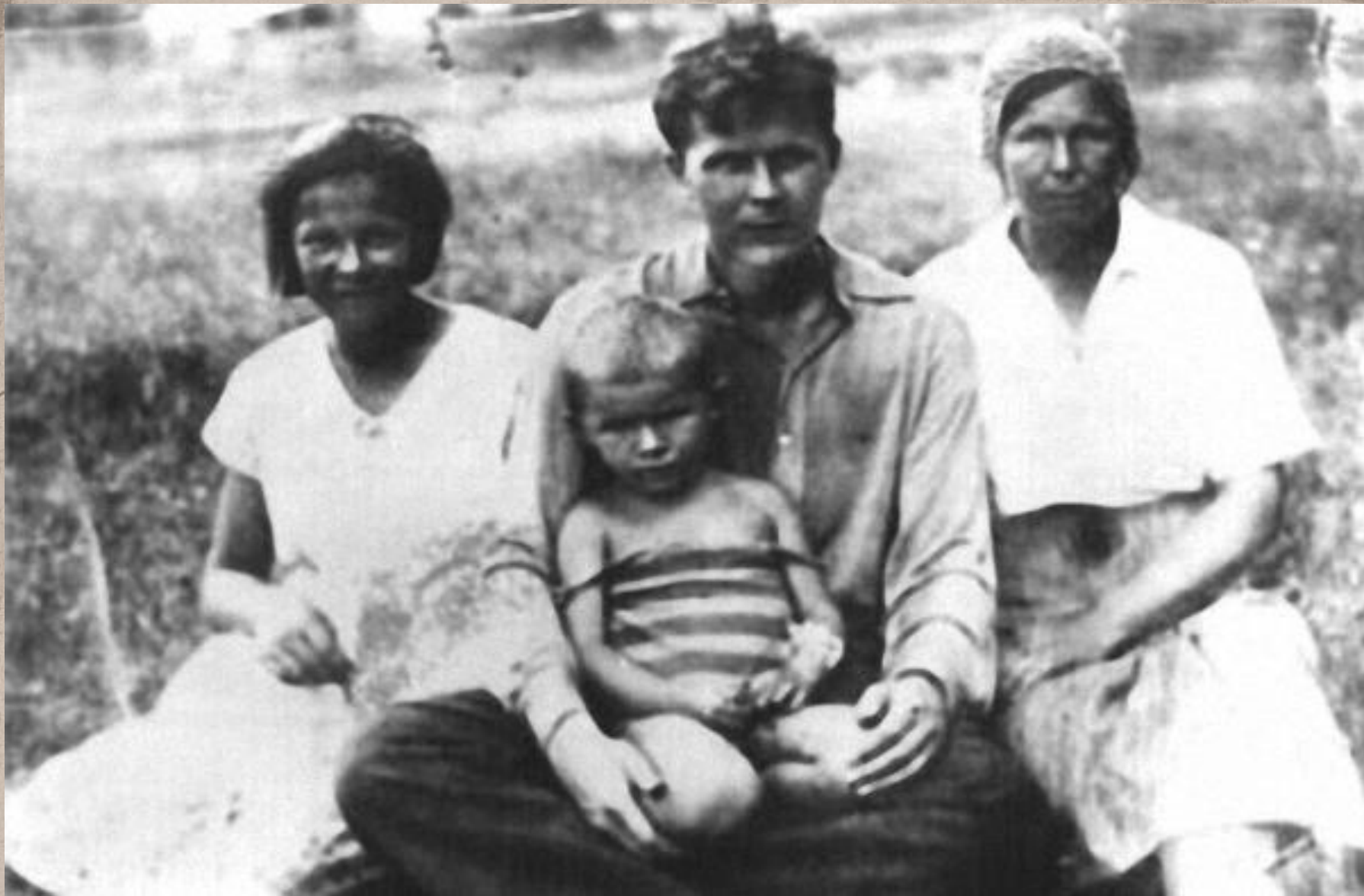
А.Т. Твардовский, мать, сестра и дочь