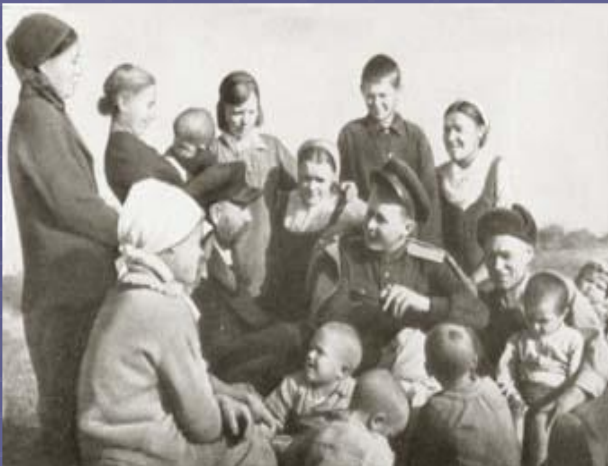
А.Т.Твардовский на Смоленщине 1943 год