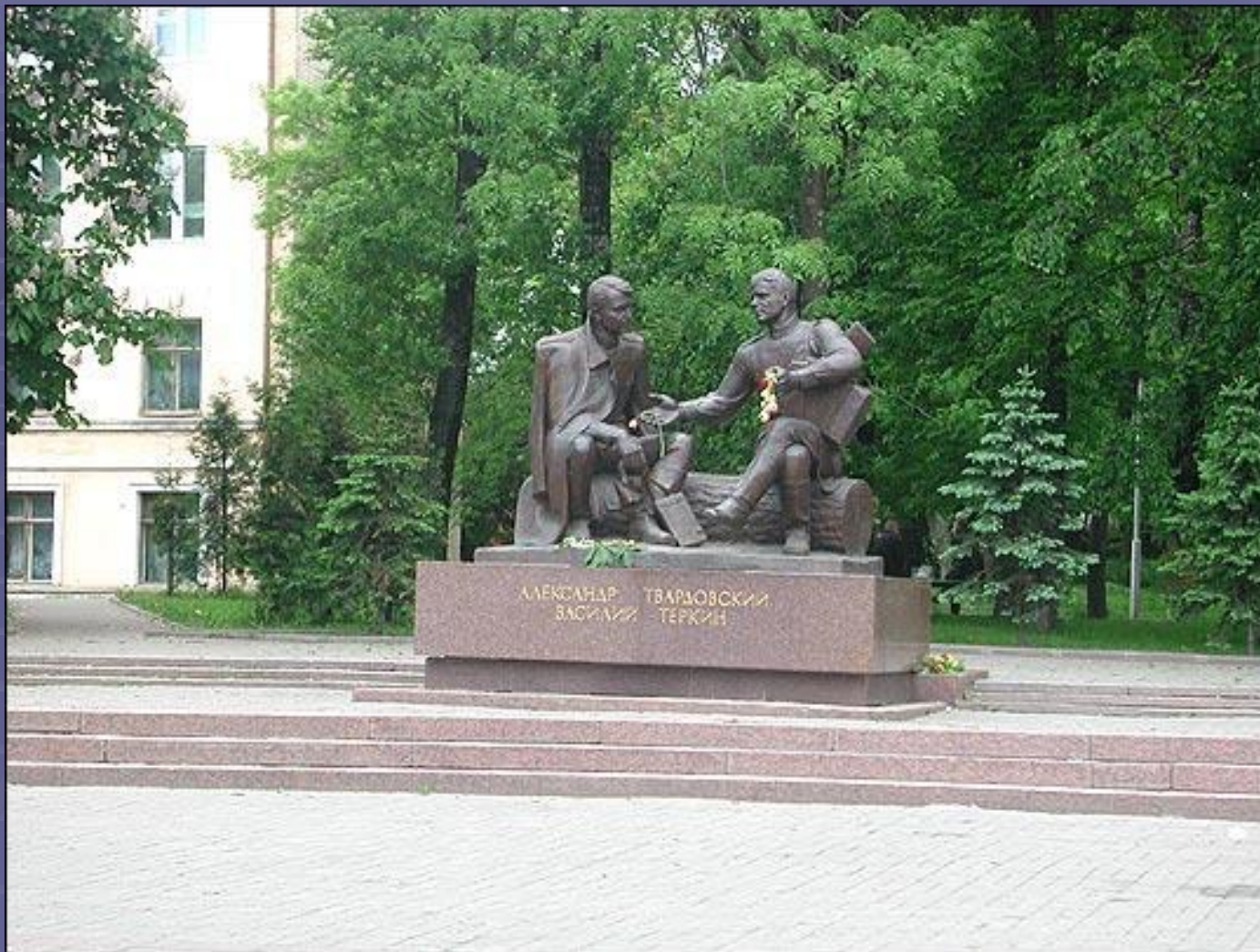
Памятник А.Т.Твардовскому и Василию Теркину в Смоленске