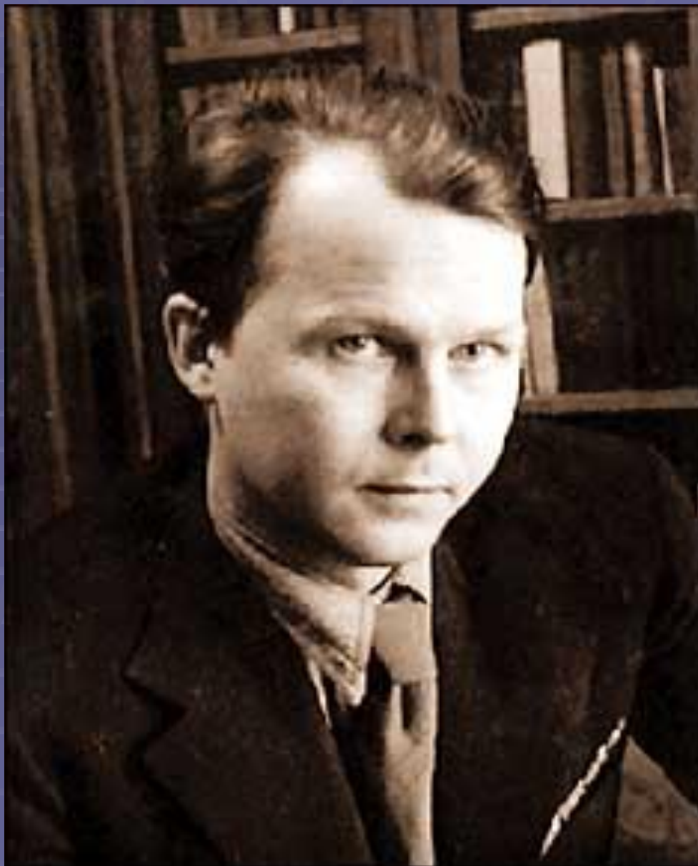
А.Т.Твардовский в 30-е годы