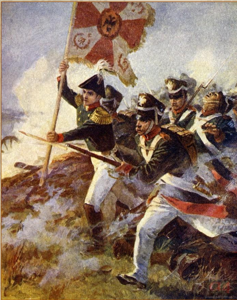
Князь Андрей со знаменем в руках в атаке под Аустерлицем. Художник В. Серов, 1951–1953

В сценах Аустерлицкого сражения и предшествующих ему эпизодах преобладают обличительные мотивы. Писатель раскрывает антинародный характер войны, показывает преступную бездарность русско-австрийского командования. Не случайно Кутузов был по существу отстранен от принятия решений. С болью в сердце полководец сознавал неизбежность поражения русской армии.