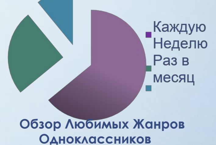
Обзор Любимых Жанров Одноклассников