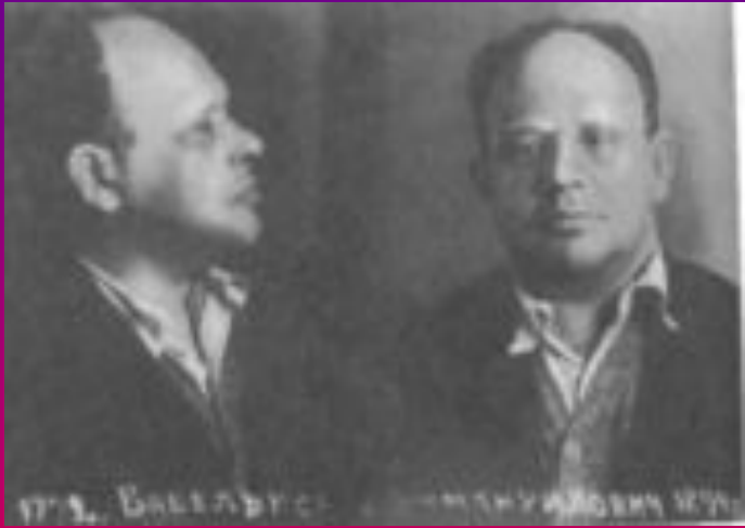
Бабель перед казнью