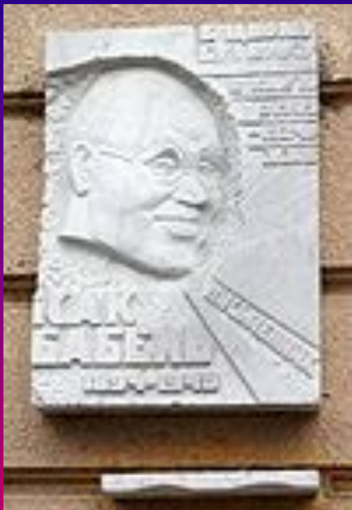
Мемориальная доска в Одессе, на доме, где он жил