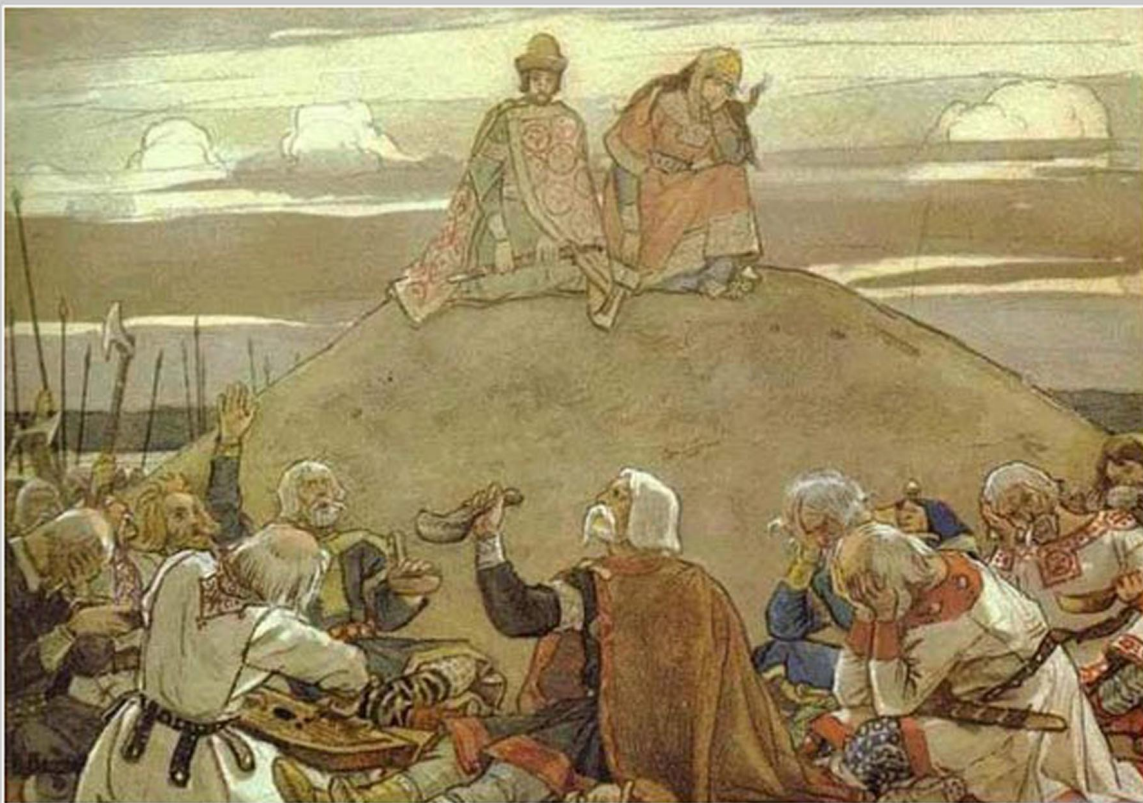
Художник: Васнецов В.