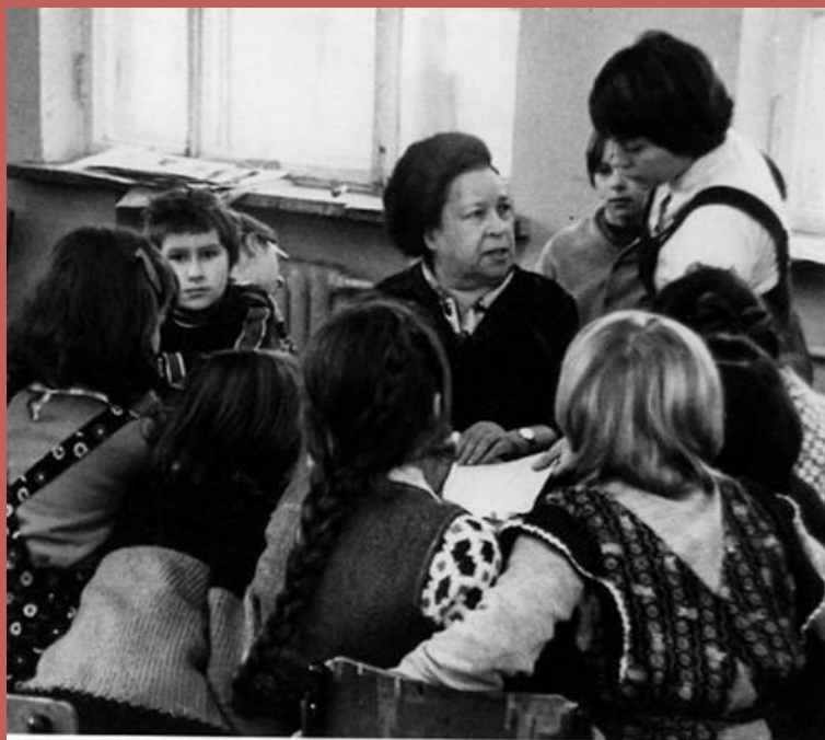
Агния Барто с учащимися школы. 1978 г.