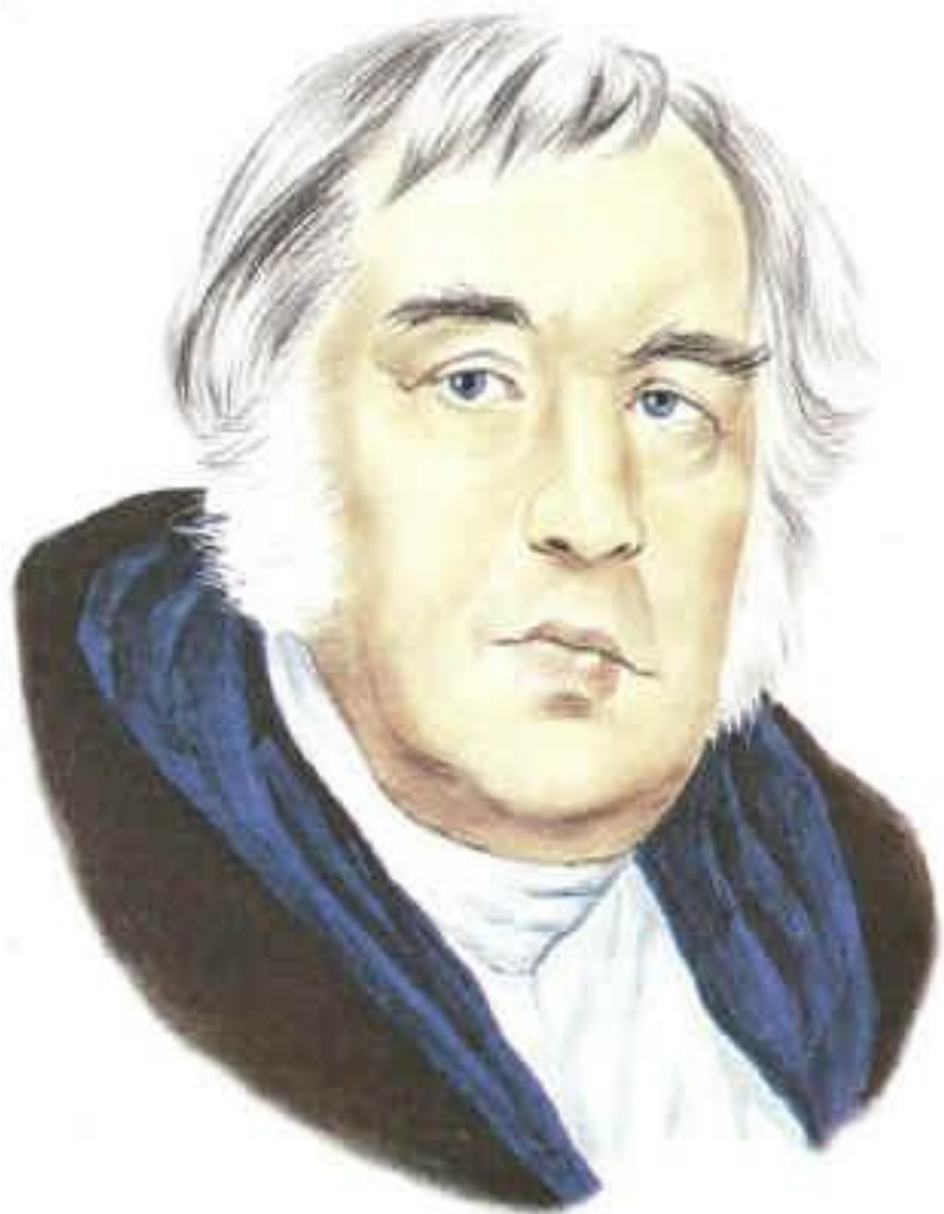
Крылов Иван Андреевич (1769-1844)