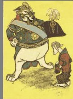
Иллюстрация к басне И. А. Крылова "Волк и Ягненок"