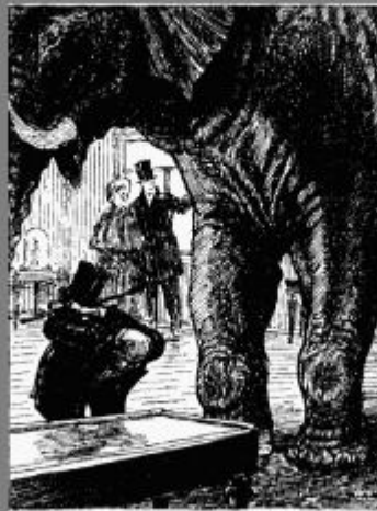
Иллюстрация к басне И. А. Крылова "Любопытный"