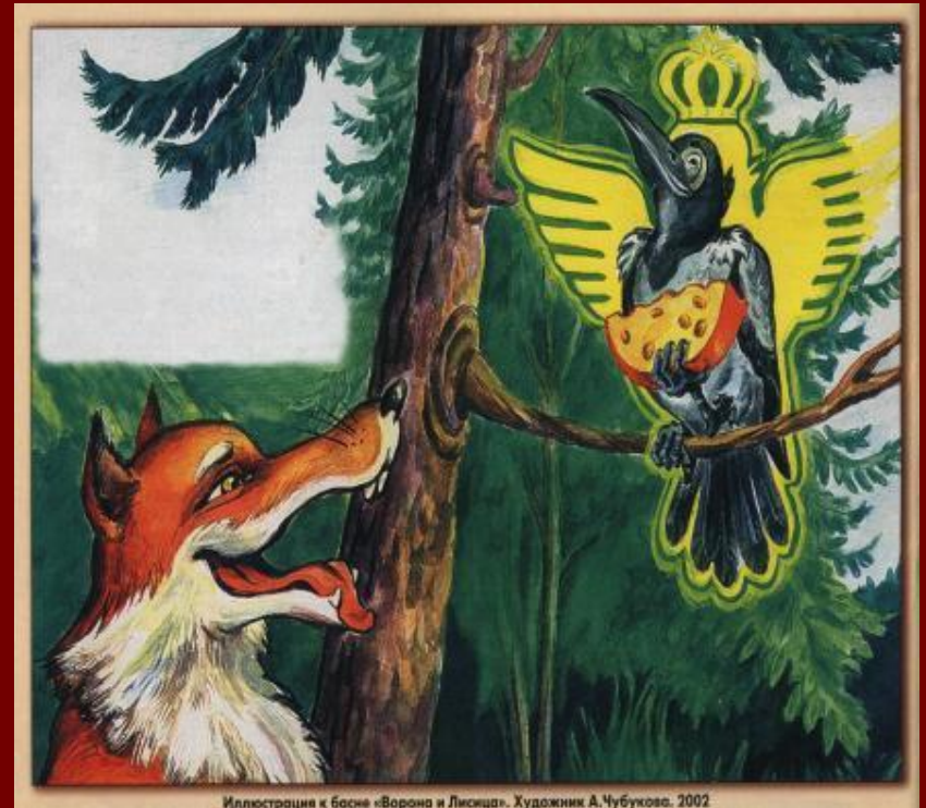
Иллюстрация к басне «Ворона и Лисица». Художник А. Чубукова, 2002

Кормится от тех, кто его слушает, - Вот урок вам, а урок стоит сыра