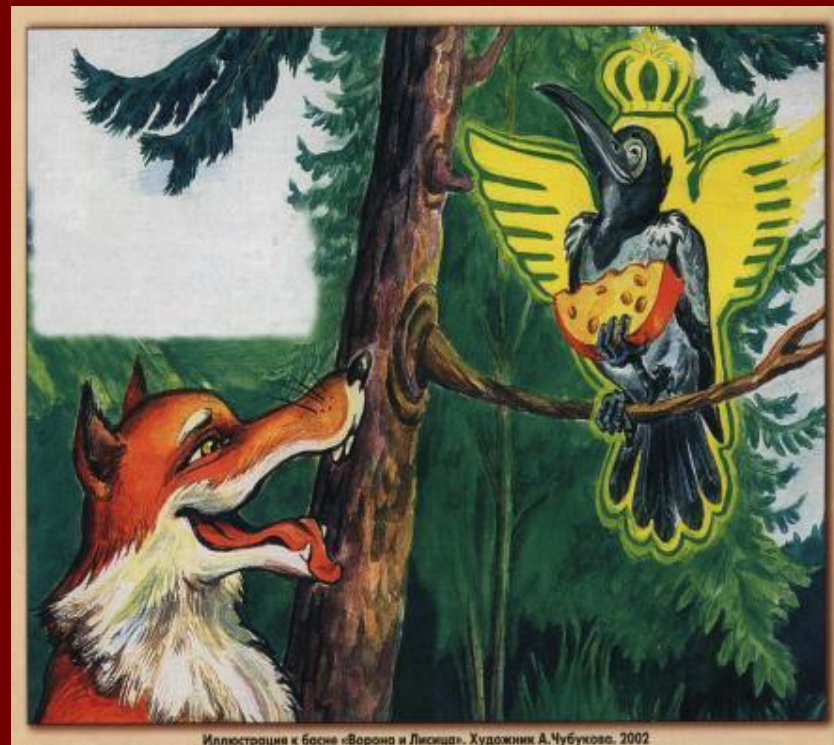
Иллюстрация к басне «Ворона и Лисица». Художник А. Чубукова, 2002

Кормится от тех, кто его слушает, - Вот урок вам, а урок стоит сыра