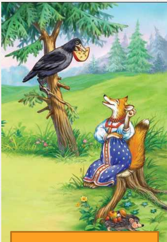
Ворона и лисица