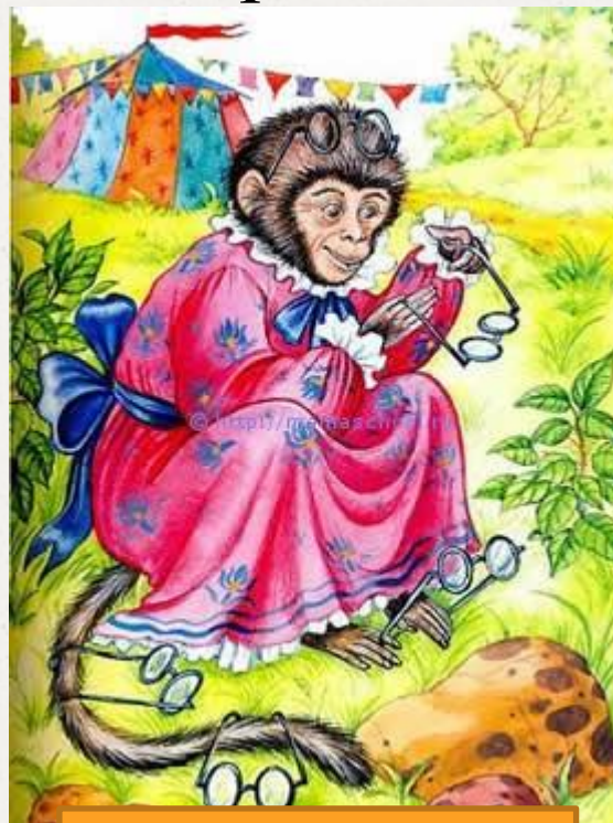
Мартышка и очки