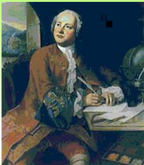
М. В. Ломоносов