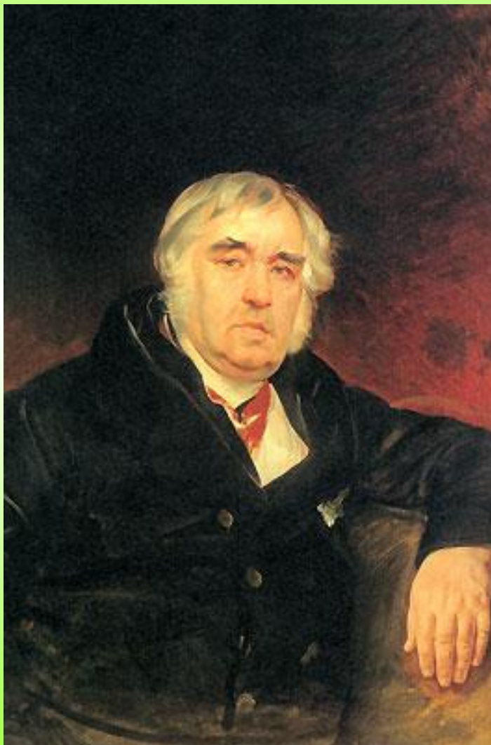
И. А. Крылов