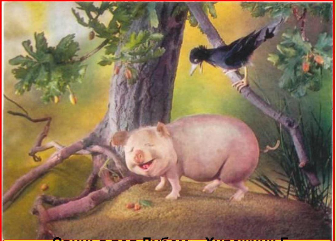
«Свинья под Дубом». Художник Г. Куприянов