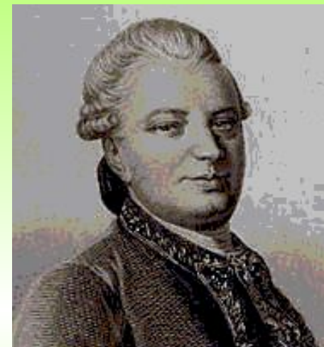
В. И. Майков