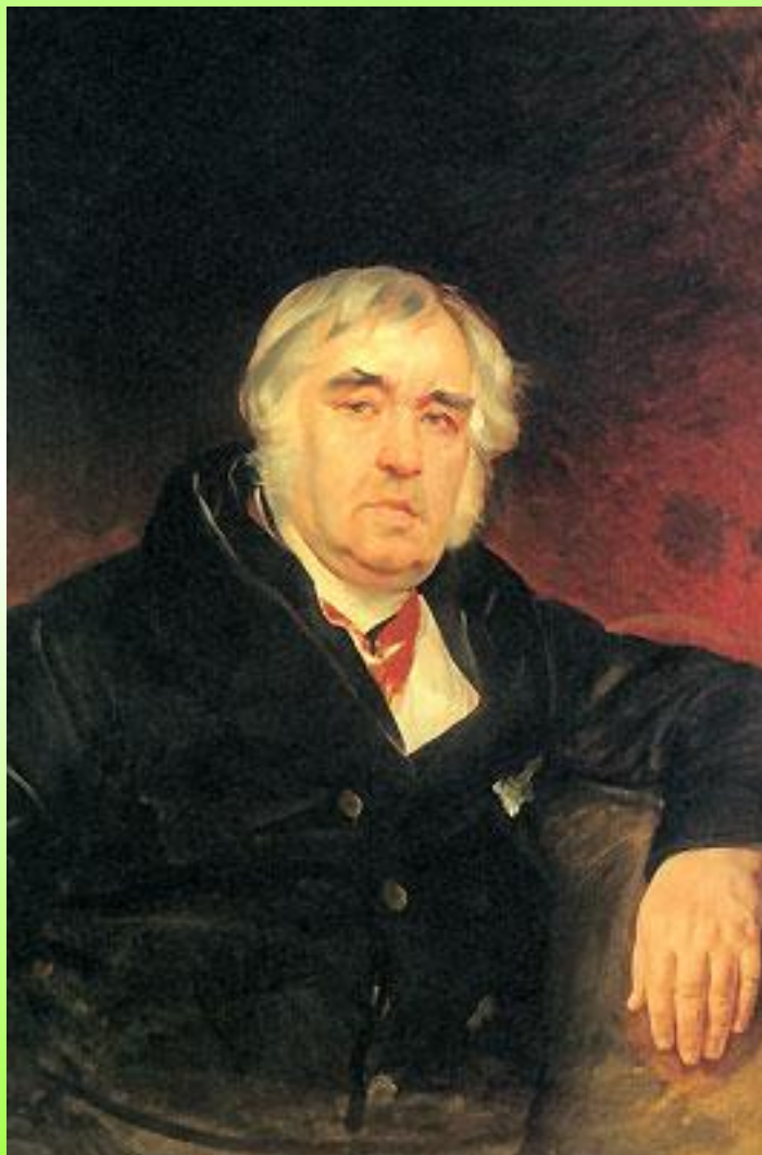
И. А. Крылов