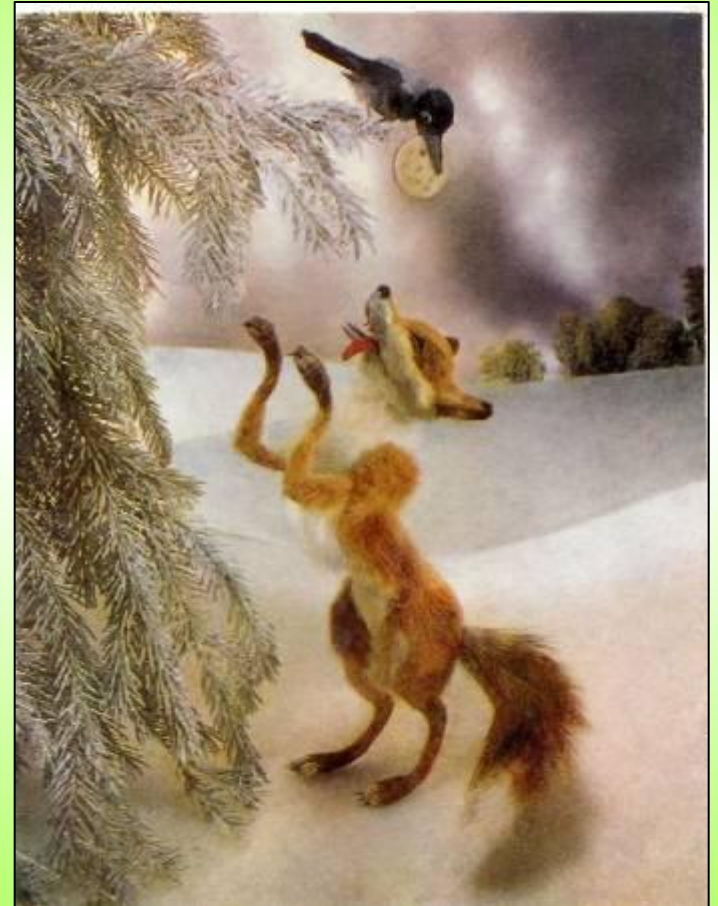
«Ворона и Лисица». Худ. Г. Куприянов