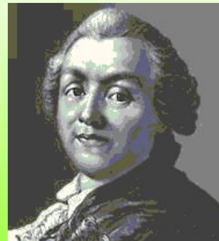
А. П. Сумароков