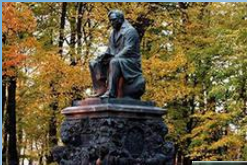
Памятник И.А. Крылову.

жадность, глупость, наглую самоуверенность.