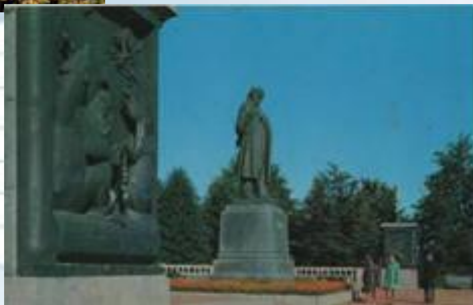
Памятник И.А. Крылову.

Басни его высмеивают не людей, а их пороки :