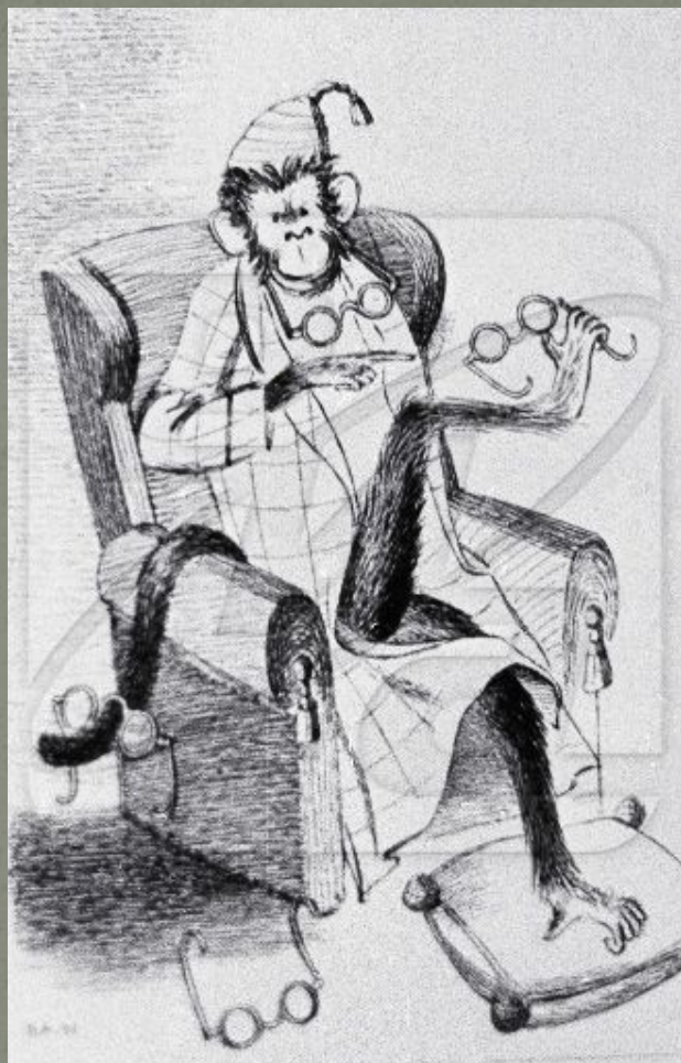
Мартышка и очки