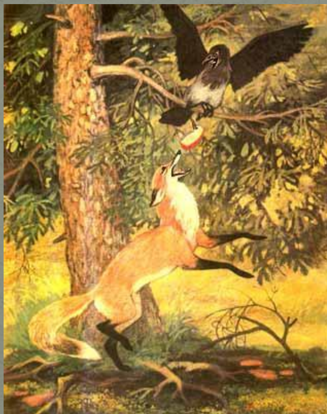
Ворона и лисица