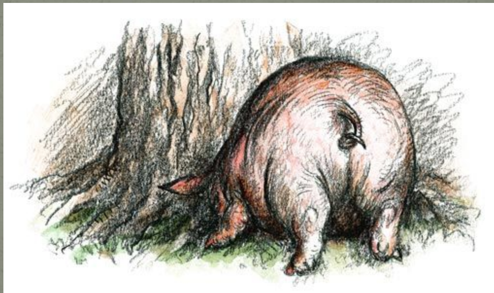
Свинья под дубом