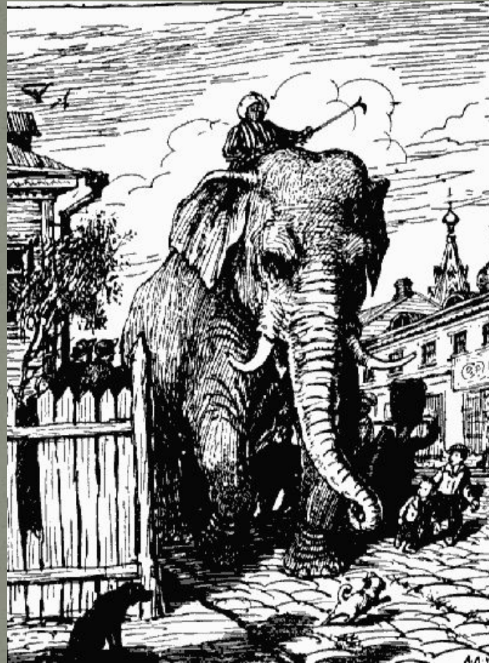
Слон и Моська