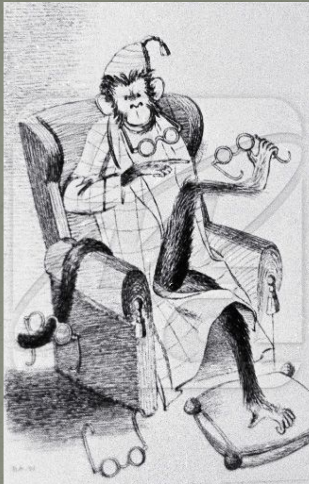
Мартышка и очки