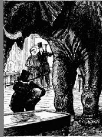
Иллюстрация к басне И. А. Крылова "Любопытный"