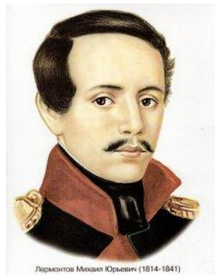
Лермонтов Михаил Юрьевич (1814-1841)