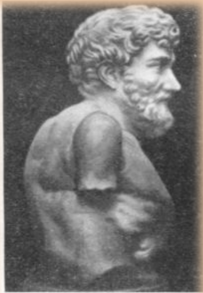
Эзоп — горбатый мудрец. Мрамор. VI в. до н. э. Вилла Альбани

Так и у людей иные не могут добиться успеха по причине того, что силы нет, а винят в этом обстоятельства.