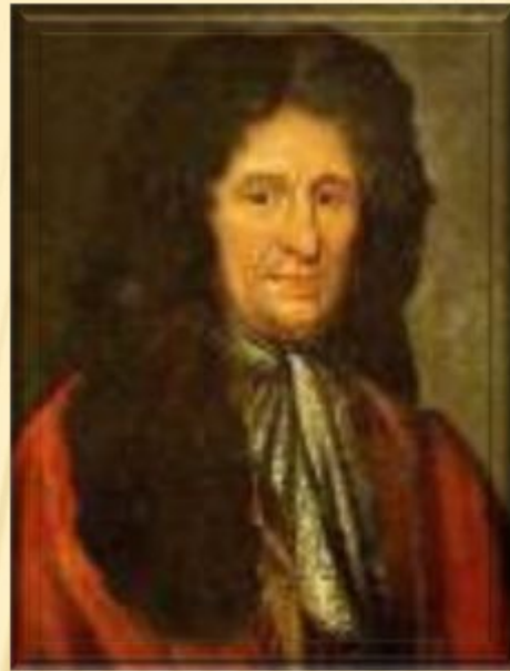
Жан де Лафонтен