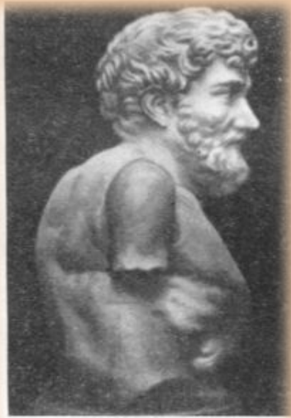
Эзоп — горбатый мудрец. Мрамор. VI в. до н. э. Вилла Альбани