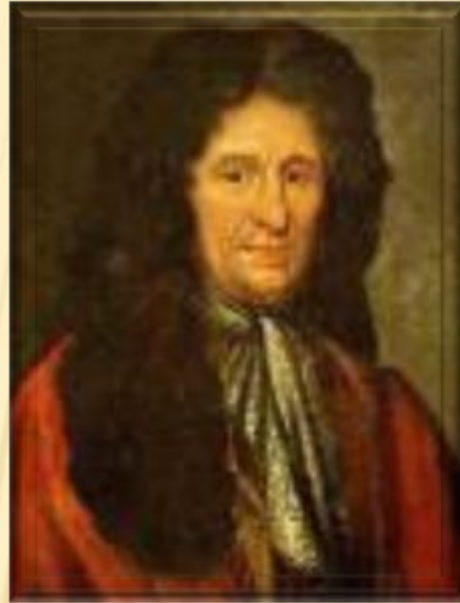
Жан де Лафонтен