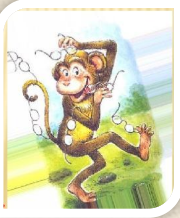
«Мартышка и очки»