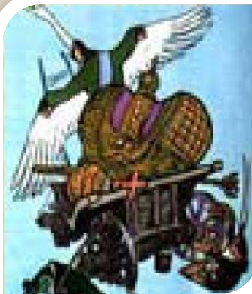
«Лебедь, Щука и Рак»