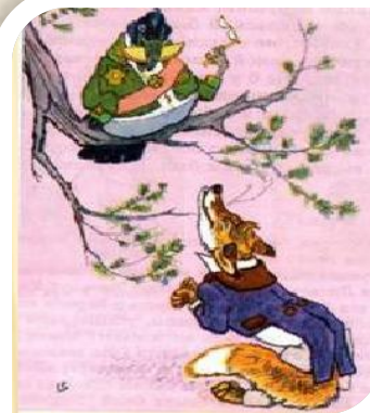
«Ворона и Лисица»