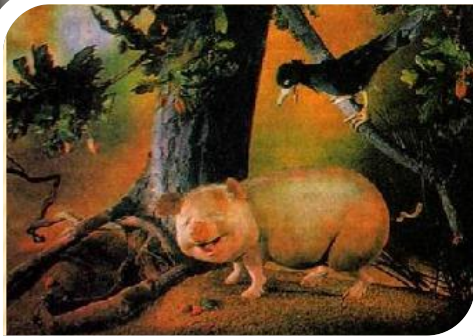
«Свинья под дубом»