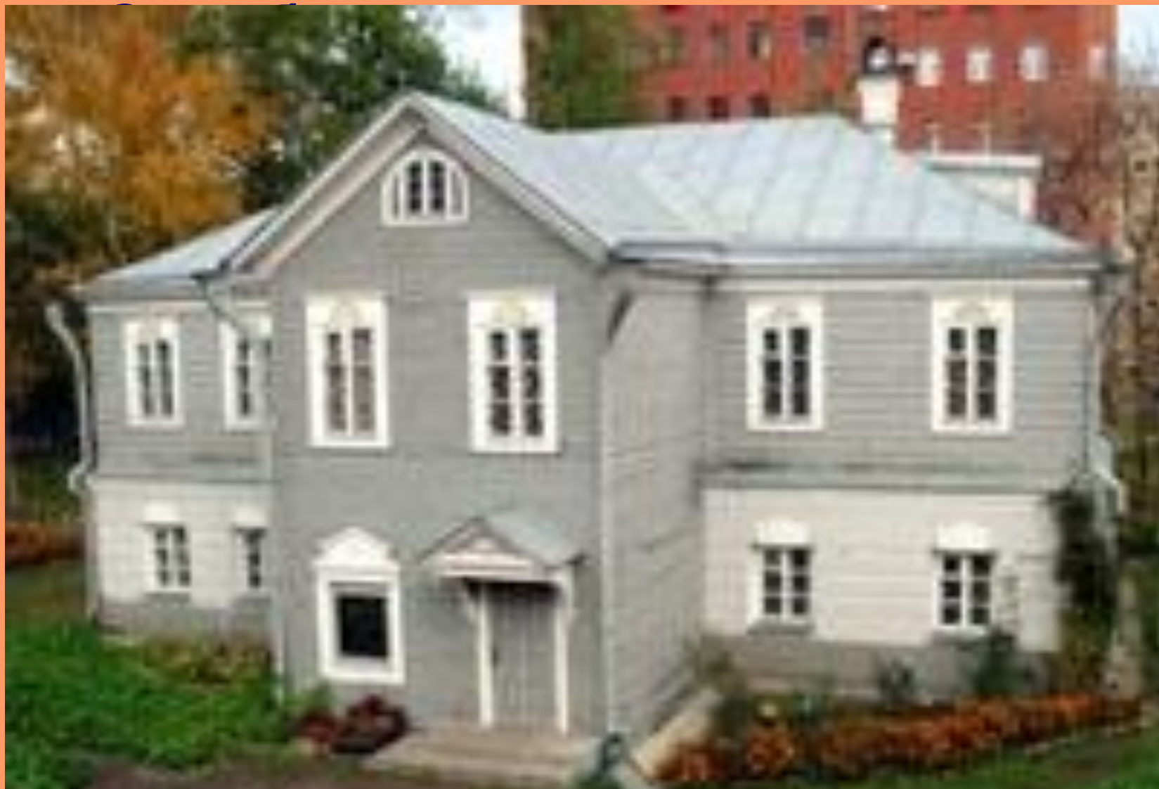
Дом-музей А.Н.Островского в Замоскворечье