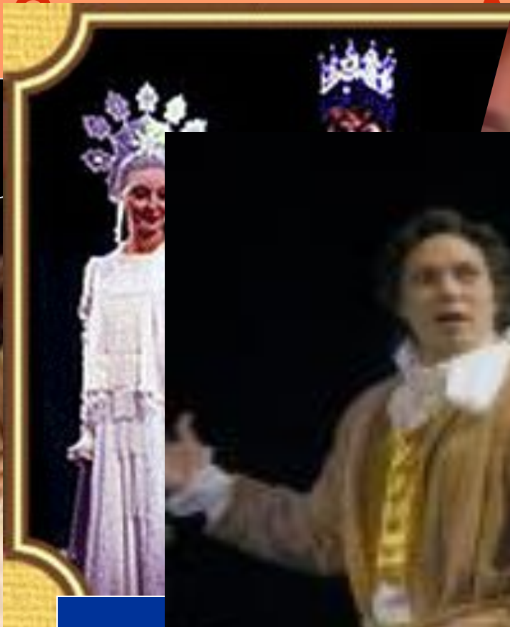
Сцена из др