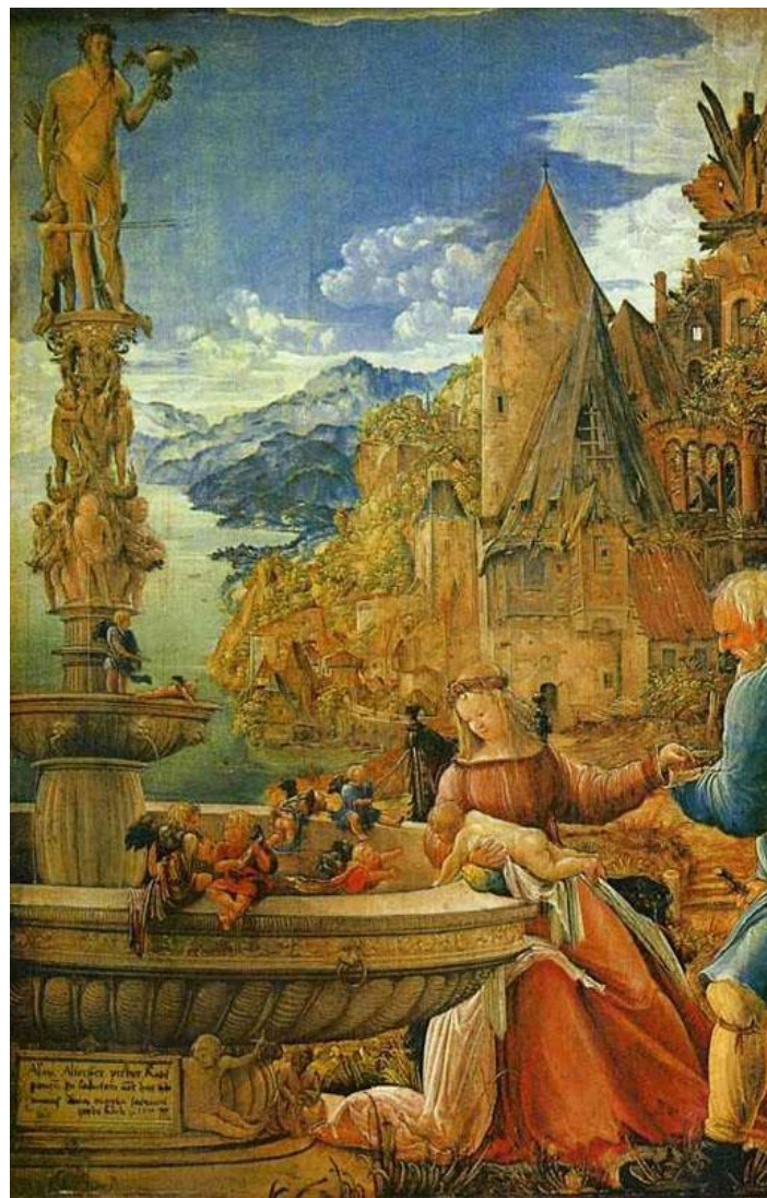
■ Альтдорфер Альбрехт. Отдых на пути в Египет. 1510 г.