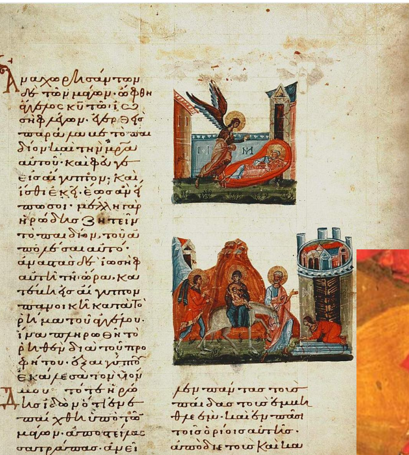
Сон Иосифа и Бегство в Египет, миниатюры из Слов Григория Назианзина. XI в. (Византия)