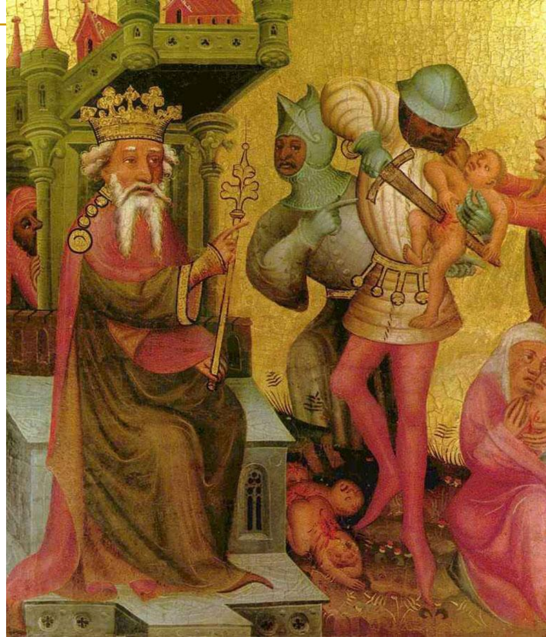
■ Бертрам из Миндена Мастер Грабовский Алтарь. Избиение младенцев. ок. 1379 г.