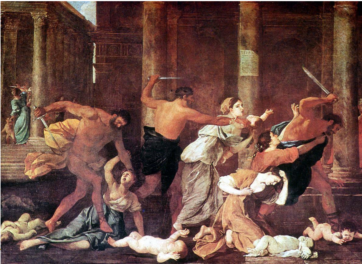
Никола Пуссен. Избиение младенцев (1625—1626)