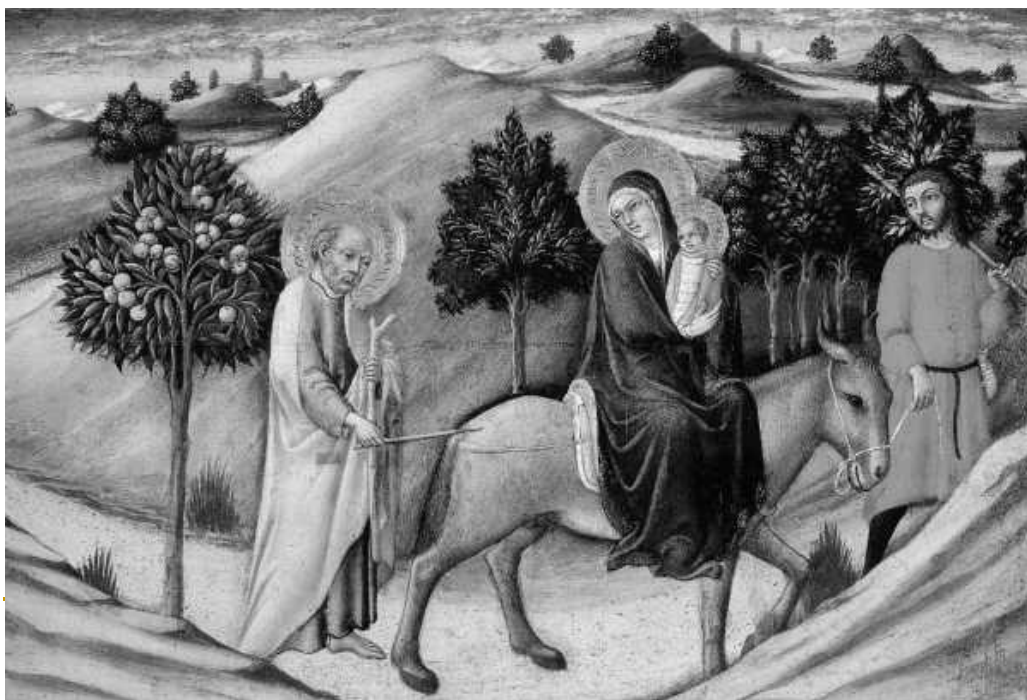
■ Бегство Святого Семейства в Египет. Сано ди Пьетро. Середина XV века. Ватикан