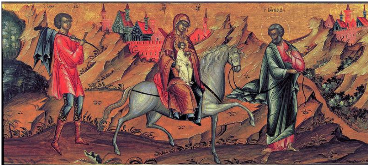
■ Бегство в Египет. Икона, XVIII в.