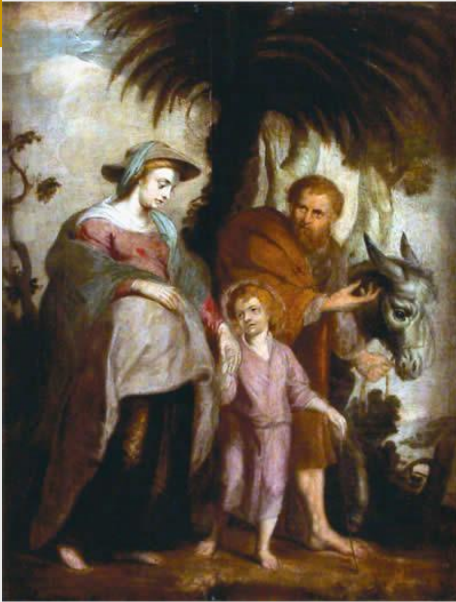
■ Питер Пауль Рубенс. Возвращение из Египта. Эскиз. 1614