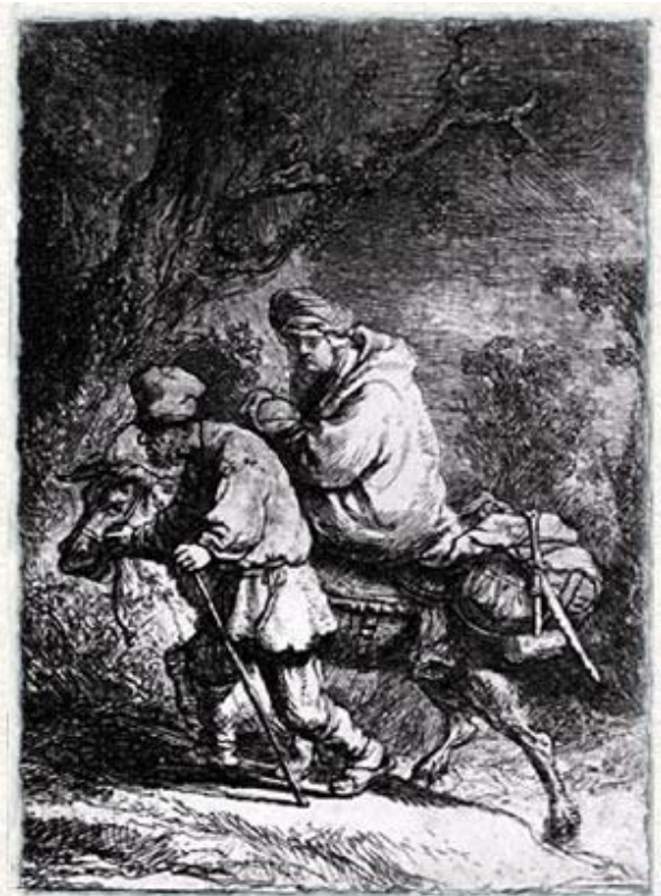
1633 г. Рембрандт. Бегство в Египет. Гравюра, 8,9 х 6,2 см.