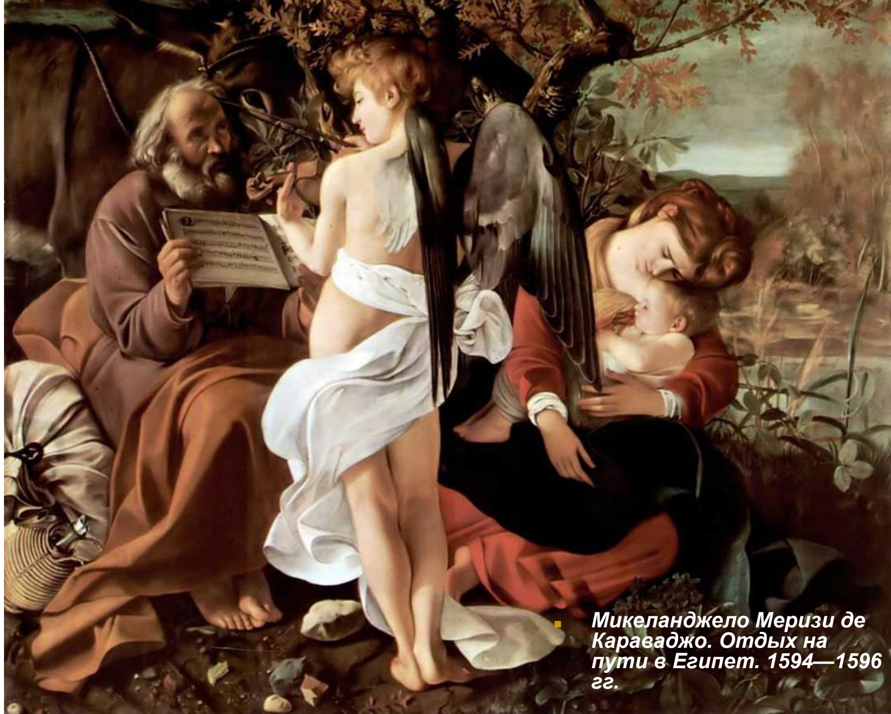
■ Микеланджело Меризи де Караваджо. Отдых на пути в Египет. 1594—1596 гг.