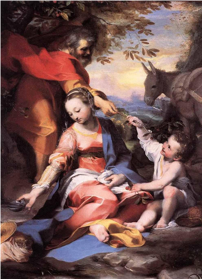
Федерико Бароччи . «Отдых по пути в Египет», 1570 г.