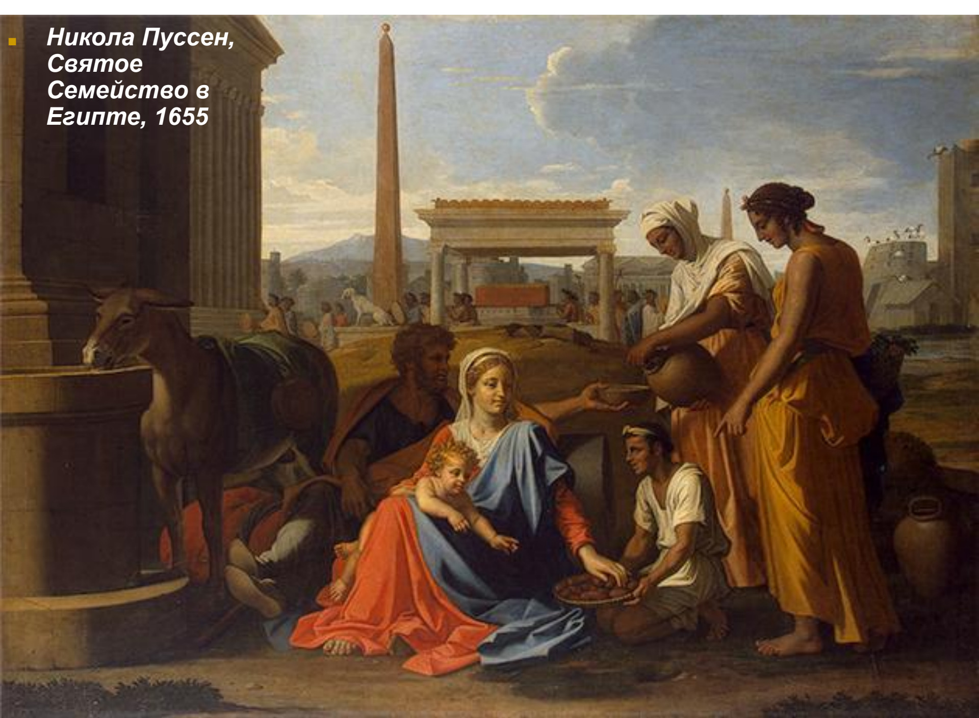
■ Никола Пуссен, Святое Семейство в Египте, 1655