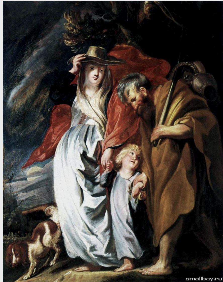
■ Йорданс, Возвращение из Египта