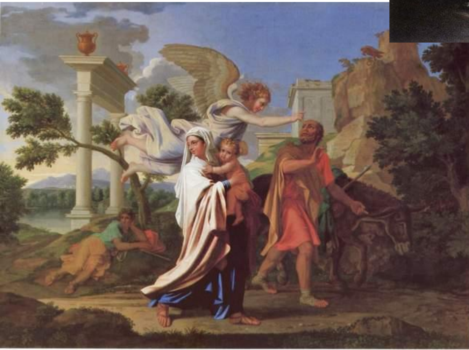
Пуссен, 1657 г.