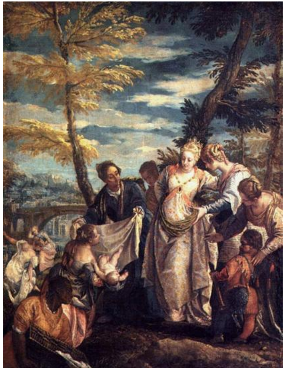
Веронезе. Бегство в Египет 1580г.