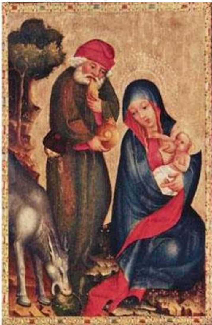
Бертрам из Миндена Мастер Грабовский Алтарь. Отдых на пути в Египет. ок. 1379 г.