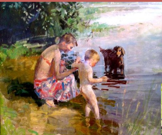
Соломин Н. Холодное утро