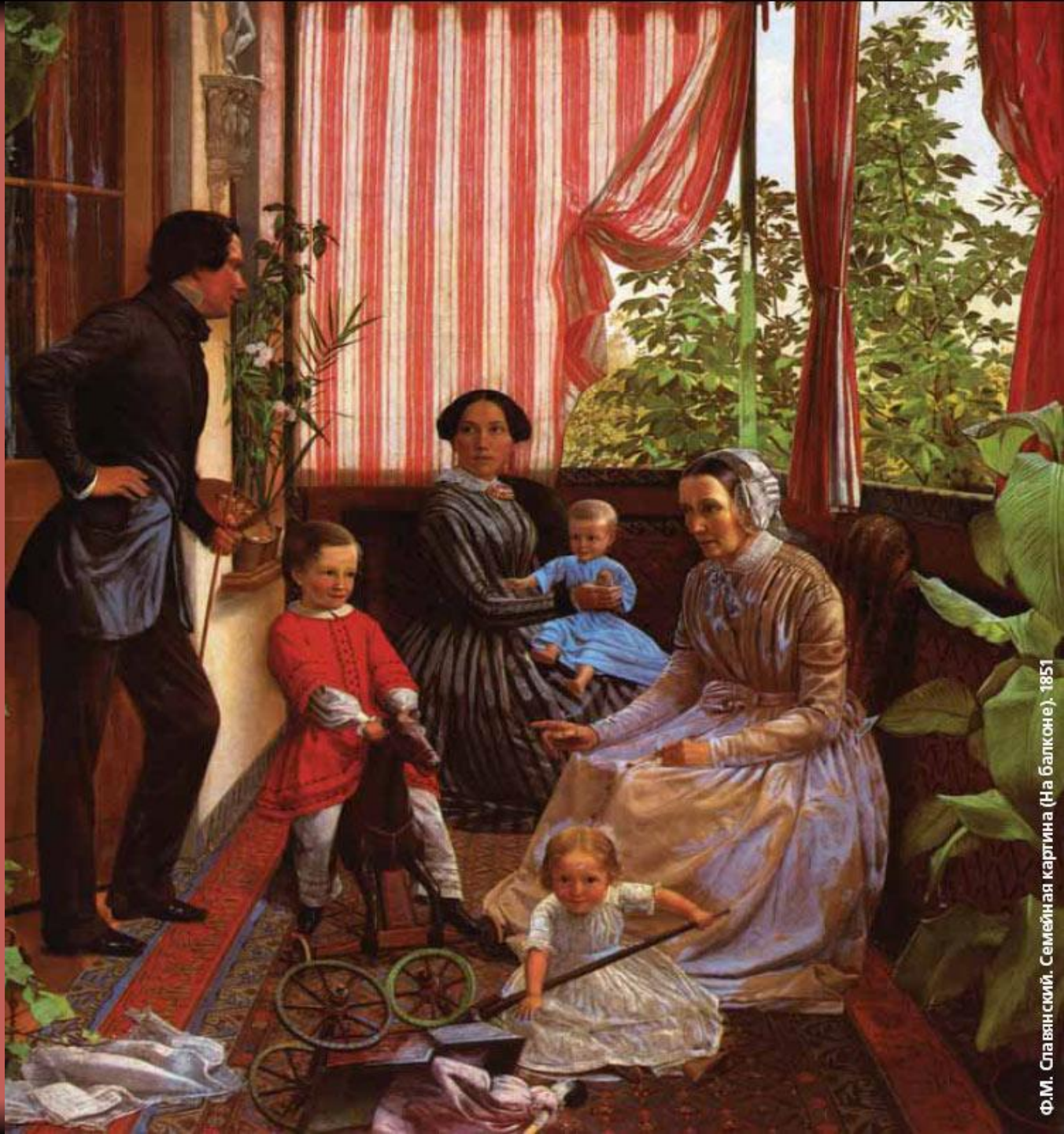
Ф.М. Славянский. Семейная картина (На балконе). 1851