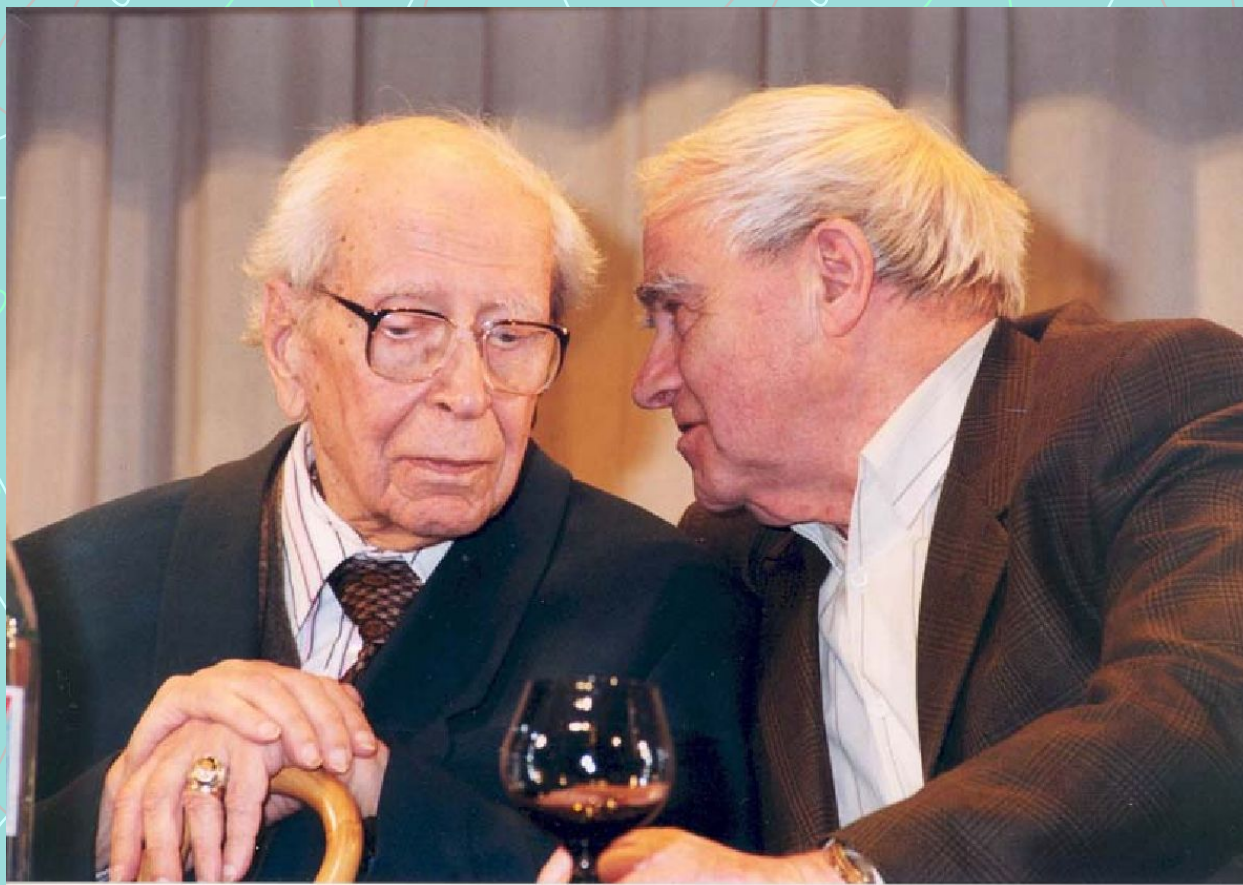
Д. С. Лихачев и Д. А. Гранин. 1990-е гг.

Из письма семнадцатого «Уметь спорить с достоинством».