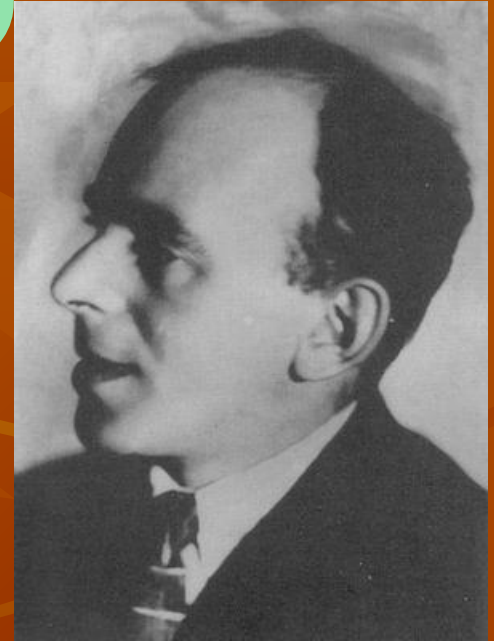
Стихотворение «В том времени, где и злодей...»