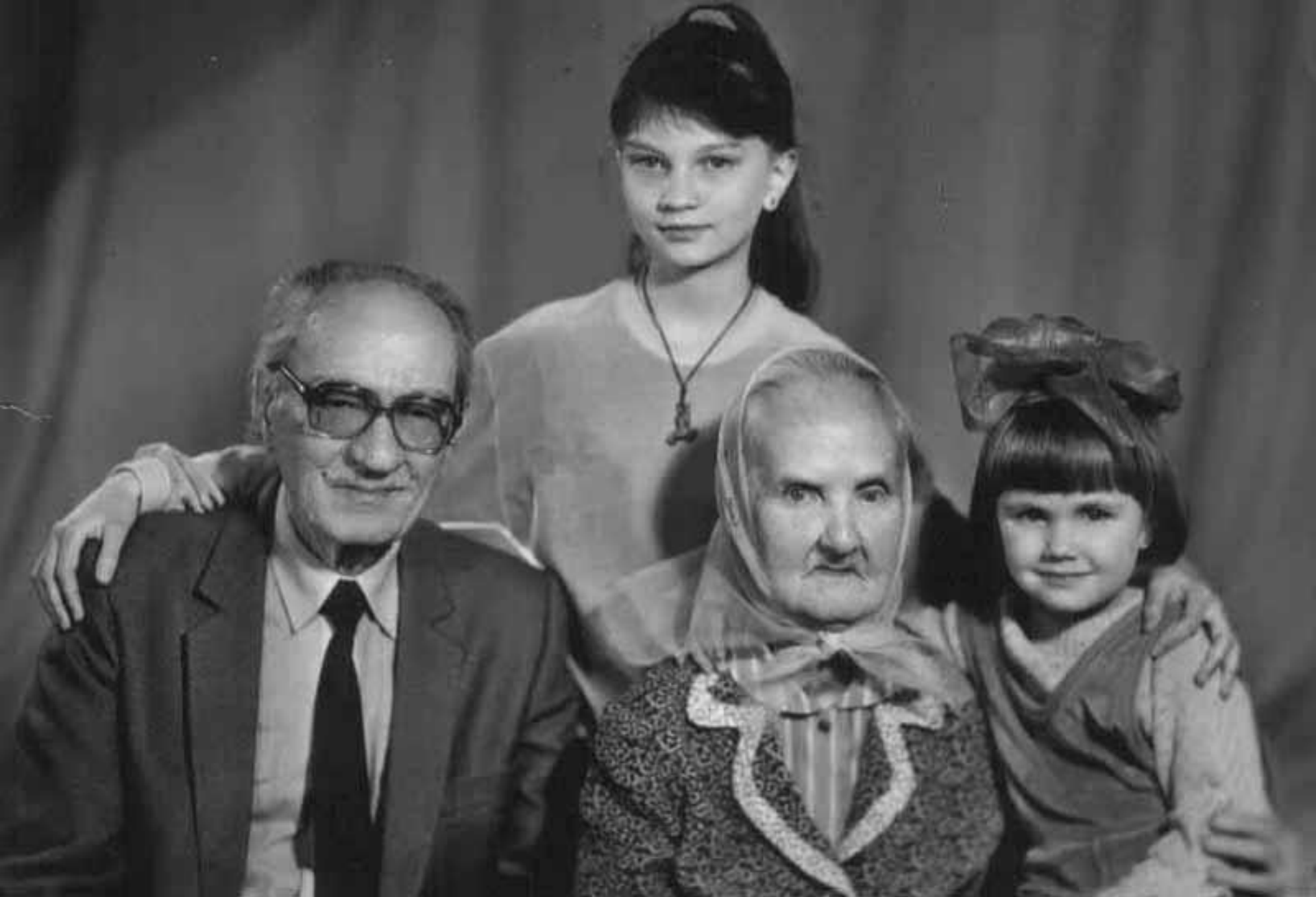
Писатель с правнучками