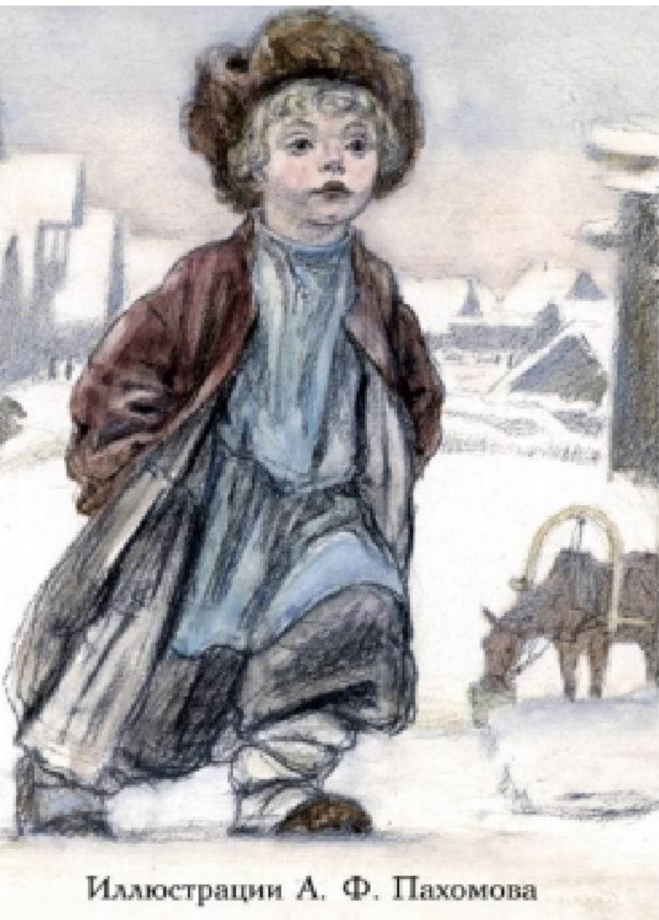
Иллюстрации А. Ф. Пахомова