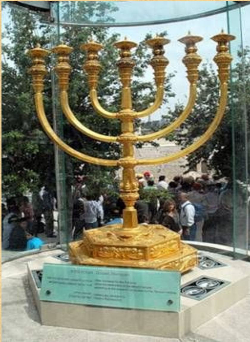
Золотой семисвечник в Иерусалиме