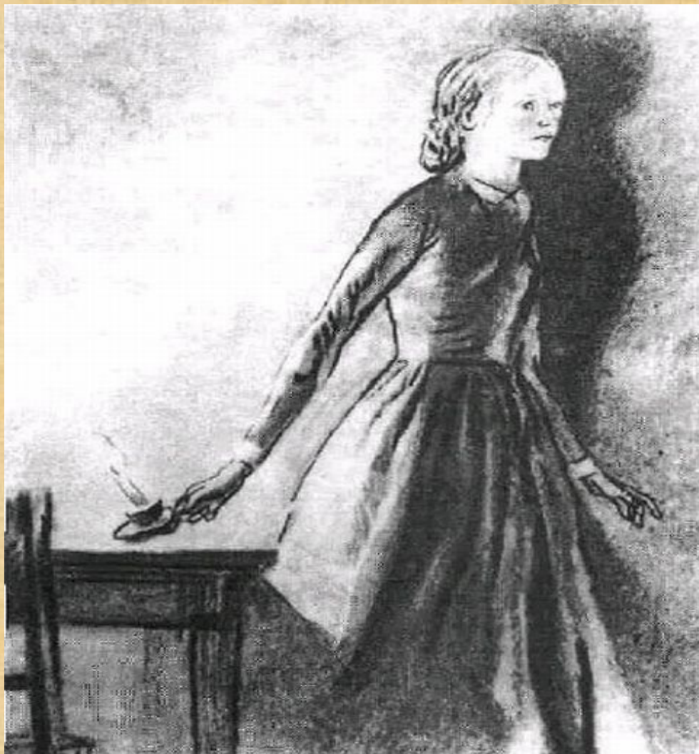
«Соня Мармеладова» Д.Шмаринов