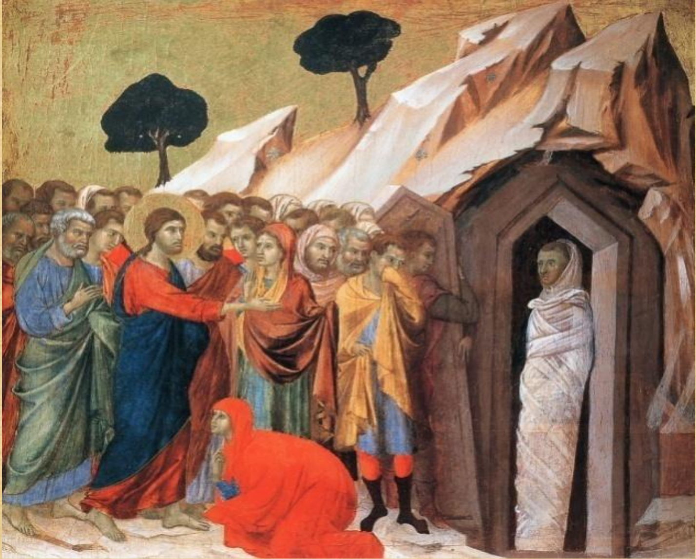
Икона «Воскрешение Лазаря»