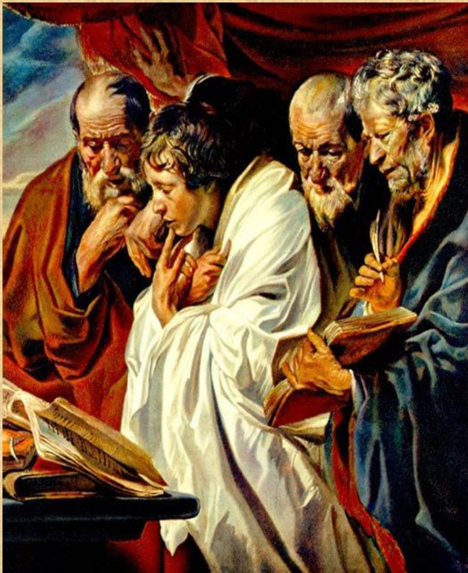
Йорданс «Четыре евангелиста»