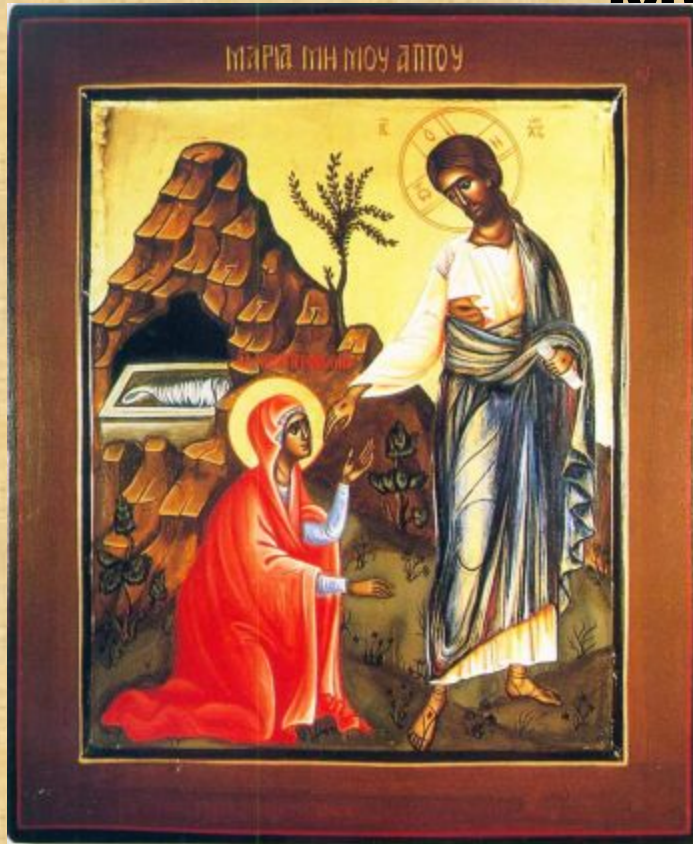
Икона “Явление Иисуса Христа Марии Магдалине по воскресении”

«Постоянно читающий божественные Писания(в простоте сердца) и стоящий при их потоках, хотя бы не имел никакого толкования, как бы корнями впитывает великую пользу».