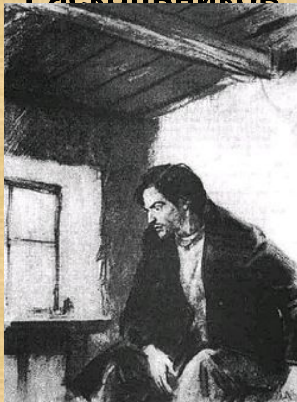
«Раскольников» Шмаринов Д. А.