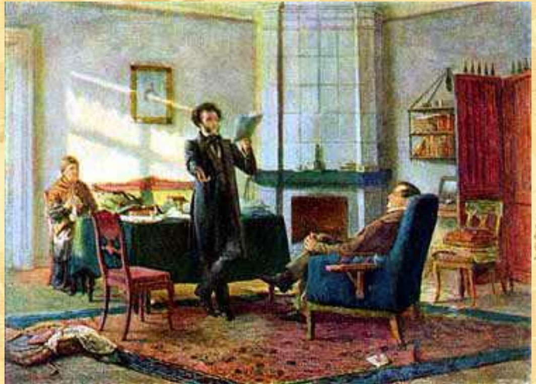
Пушкин в селе Михайловском (Пушкин у Пушкина). Н.Н. Ге. 1875 г.

За три года ссылки написаны "Кавказский пленник", "Бахчисарайский фонтан", а также "Узник", "Песнь о вещем Олеге". Начат роман в стихах "Евгений Онегин".