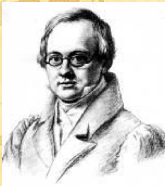
Антон Антонович Дельвиг