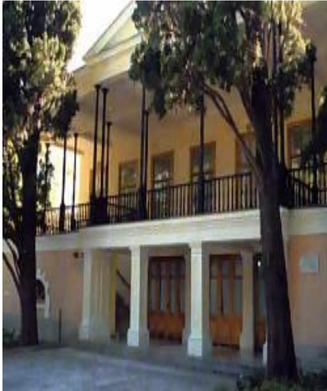
Гурзуф и Феодосия

4 сентября 1826 года Николай 1 неожиданно вызвал Пушкина в Москву. Но свобода, предоставленная царем, была недолгой. Уже в 1828 году вышло постановление Государственного совета о надзоре над Пушкиным. В этом же году он самовольно уехал на Кавказ, где служили его друзья.