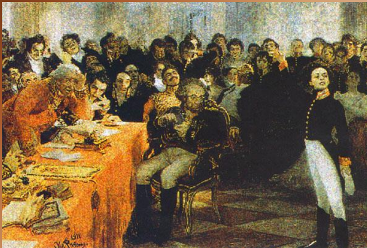
И. Репин, 1911

Воспитанник Царскосельского лицея 15-летний Александр Пушкин в день публичного экзамена, переходного в старший класс, привел в восторг всех присутствовавших чтением своего стихотворения «Воспоминания в Царском Селе». Знаменитый российский поэт Гаврила Романович Державин, пораженный талантом юноши, склонил перед ним голову.