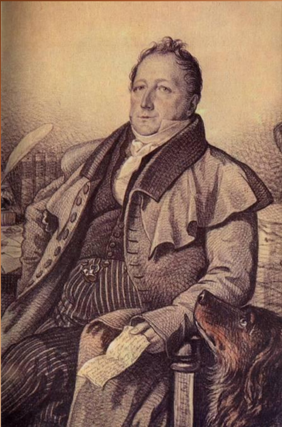
Сергей Львович Пушкин (1770-1848) отец поэта