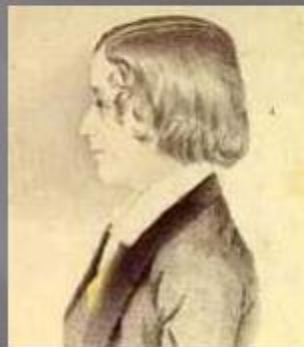
Старший сын, Александр Александрович Пушкин (1833-1914г.)