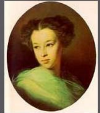
Младшая дочь, Наталья Александровна Пушкина (1836-1913г.) Получила