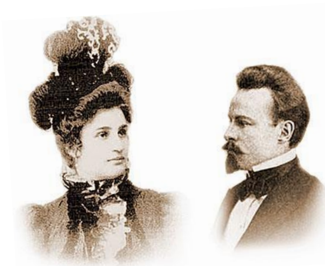
М. Лохвицкая и К. Бальмонт.

Не случайно многие поэты посвящали ему свои стихотворения М. Лохвицкая, В. Брюсов, А. Белый, Вяч. Иванов, М. Волошин, С. Городецкий и др. Все они видели в нем, прежде всего, «стихийного гения», «вечно вольного, вечно юного» Ариона, обреченного стоять «где-то там на высоте» и полностью погруженного в откровения своей бездонной души. О, кто из нас в лирические бури Бросался, наг, как нежный Лионель?..