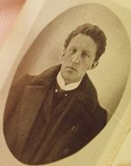
A. S. ... ..